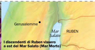
I discendenti di Ruben vissero a est del Mar Salato (Mar Morto)