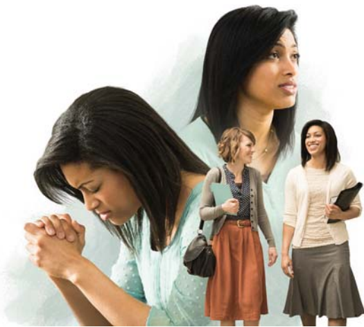
Ia e mautinoa i le faamagaloga a Ieova (Taga'i i le palakalafa e 14-16)

toeaina le mataupu ma fesoasoani iā te ia e toe maua se lotofuatiāifo mamā, na ia faapea mai: “E pei ua mafai ona ou toe mānava. Ina ua uma ona taulima lelei le mataupu, ou te le'i toe lagona le nofosala. E uma loa ona faamagalo se agasala, ua mou atu e faavavau lenā agasala. E pei lava ona fetalai Ieova, e na te aveesea a tatou avega mamafa ma faamamao ese mai iā i tatou. E te lē toe vaai lava i ai.” O le taimi lava e iai le tagata sulufa'i i totonu o le aai o sulufa'iga, e lē tatau ona toe popole ina ne'i maua o ia e lē na te tauimasui i le toto. I se tulaga talitutusa, o le taimi lava e faamagalo ai e Ieova a tatou agasala, e lē tatau ona tatou popole o le a toe lāgā e Ieova lenā agasala, pe toe faamasinoina ai fo'i i tatou. — Faitau le Salamo 103:8-12.