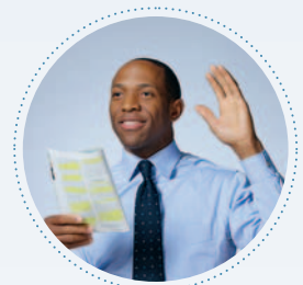
ਮੀਟਿੰਗਾਂ ਆਪਣੇ ਦਿਲ ਦੀ ਜਾਂਚ ਕਰਨ ਵਿਚ ਮਦਦ ਕਰਦੀਆਂ ਹਨ