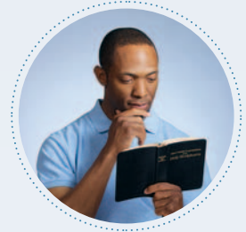
ਬਾਈਬਲ ਪੜ੍ਹਨ ਦਾ ਸਾਡੇ ਦਿਲ 'ਤੇ ਕੀ ਅਸਰ ਪੈਂਦਾ ਹੈ?

ਜਿੰਦਾਂ-ਜਿੰਦਾਂ ਸਾਡੀ ਉਮਰ ਵਧਦੀ ਹੈ, ਉੱਦਾਂ-ਉੱਦਾਂ ਸ਼ਾਇਦ ਅਸੀਂ ਆਪਣੇ ਬੁਢਾਪੇ ਬਾਰੇ ਚਿੰਤਾ ਕਰਨ ਲੱਗ ਪਈਏ। ਇਸ ਕਰਕੇ ਅਸੀਂ ਸ਼ਾਇਦ ਪੈਸਾ ਕਮਾਉਣ ਬਾਰੇ ਇੰਨਾ ਸੋਚੀਏ ਕਿ ਮੀਟਿੰਗਾਂ ਵਾਲੇ ਦਿਨ ਓਵਰਟਾਈਮ ਕਰਨ ਨੂੰ ਵੀ ਸਹੀ ਸਮਝੀਏ ਜਾਂ ਅਸੀਂ ਆਪਣੀਆਂ ਮਸੀਹੀ ਜ਼ਿੰਮੇ-ਵਾਰੀਆਂ ਨੂੰ ਵੀ ਨਜ਼ਰਅੰਦਾਜ਼ ਕਰਨ ਲੱਗ ਪਈਏ। ਜਾਂ ਸ਼ਾਇਦ ਅਸੀਂ ਜਵਾਨ ਹੋਈਏ ਤੇ ਸਾਨੂੰ