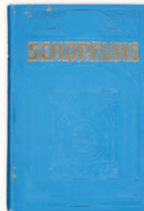
▲ 1932 ਵਿਚ “ਸ੍ਰਿਸ਼ਟੀ ਡਰਾਮਾ” ਦੀ ਮਸ਼ਹੂਰੀ ਕਰਨ ਲਈ ਪੋਸਟਰ