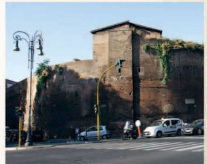
ਅੱਜ ਕੈਸਟ੍ਰਾ ਪ੍ਰੇਟੋਰੀਆ ਦੀਆਂ ਕੰਧਾਂ

ਹਰ ਰੋਜ਼ ਮਹਿਲ ਵਿਚ ਅੰਗ-ਰੱਖਿਅਕਾਂ ਦੀਆਂ ਵੱਖੋ-ਵੱਖਰੇ ਟੋਲੀਆਂ ਦੀ ਡਿਊਟੀ ਲੱਗਦੀ ਸੀ। ਇਸ ਕਰਕੇ ਪੌਲੁਸ ਦੀ ਨਿਗਰਾਨੀ ਕਰਨ ਲਈ ਵੱਖ-ਵੱਖ ਅੰਗ-ਰੱਖਿਅਕ ਆਉਂਦੇ ਸਨ। ਇਸ ਲਈ ਉਸ ਦੀ ਦੋ ਸਾਲ ਦੀ ਕੈਦ ਦੌਰਾਨ ਕਈ ਫ਼ੌਜੀਆਂ ਨੂੰ ਗਵਾਹੀ ਮਿਲੀ। ਉਨ੍ਹਾਂ ਨੇ ਅਫਸੀਆਂ, ਫਿਲਿੱਪੀਆਂ, ਕੁਲੱਸੀਆਂ ਅਤੇ ਇਬਰਾਨੀਆਂ ਨੂੰ ਚਿੱਠੀਆਂ ਲਿਖਵਾਉਂਦੇ ਸੁਣਿਆ ਹੋਣਾ। ਨਾਲੇ ਉਨ੍ਹਾਂ ਨੇ ਉਸ ਨੂੰ ਆਪਣੇ ਹੱਥੀਂ ਫਿਲੇਮੋਨ ਨੂੰ ਵੀ ਚਿੱਠੀ ਲਿਖਦੇ ਦੇਖਿਆ ਹੋਣਾ। ਕੈਦ ਵਿਚ ਹੁੰਦੇ ਹੋਏ ਪੌਲੁਸ ਨੇ ਉਨੇਸਿਮੁਸ ਨਾਂ ਦੇ ਗੁਲਾਮ ਦੀ ਵੀ ਮਦਦ ਕੀਤੀ ਜੋ ਫਿਲੇਮੋਨ ਦੇ ਘਰੋਂ ਭੱਜਿਆ ਸੀ। ਪੌਲੁਸ ਉਸ ਲਈ “ਕੈਦ ਵਿਚ ਹੁੰਦੇ ਹੋਏ ਪਿਤਾ ਸਮਾਨ ਬਣਿਆ” ਤੇ ਉਸ ਨੂੰ ਫਿਲੇਮੋਨ ਕੋਲ ਵਾਪਸ ਘੱਲ ਦਿੱਤਾ। (ਫਿਲੇ. 10) ਪੌਲੁਸ ਨੇ ਅੰਗ-ਰੱਖਿਅਕਾਂ ਵਿਚ ਵੀ ਜ਼ਰੂਰ ਦਿਲਚਸਪੀ ਲਈ ਹੋਈ। (1 ਕੁਰਿੰ. 9:22) ਅਸੀਂ ਕਲਪਨਾ ਕਰ ਸਕਦੇ ਹਾਂ ਕਿ ਉਸ ਨੇ ਇਕ ਫ਼ੌਜੀ ਨਾਲ