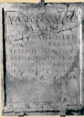
Musée Calvet Avignon

ਇਕ ਫੱਟੀ ਜਿਸ 'ਤੇ ਸੈਕਸਟਸ ਅਫ਼ਾਨੀਉਸ ਬੁਰੋਸ ਦਾ ਨਾਂ ਹੈ