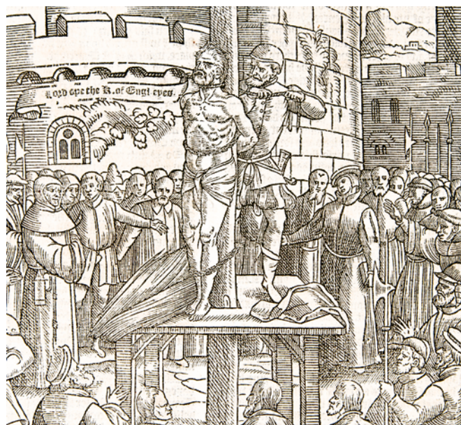
From Foxe's Book of Martyrs

ਟਿੰਡੇਲ ਤੇ ਹੋਰ ਲੋਕਾਂ ਨੇ ਪਰਮੇਸ਼ੁਰ ਦੇ ਬਚਨ ਦੀ ਖ਼ਾਤਰ ਆਪਣੀਆਂ ਜਾਨਾਂ ਕੁਰਬਾਨ ਕੀਤੀਆਂ