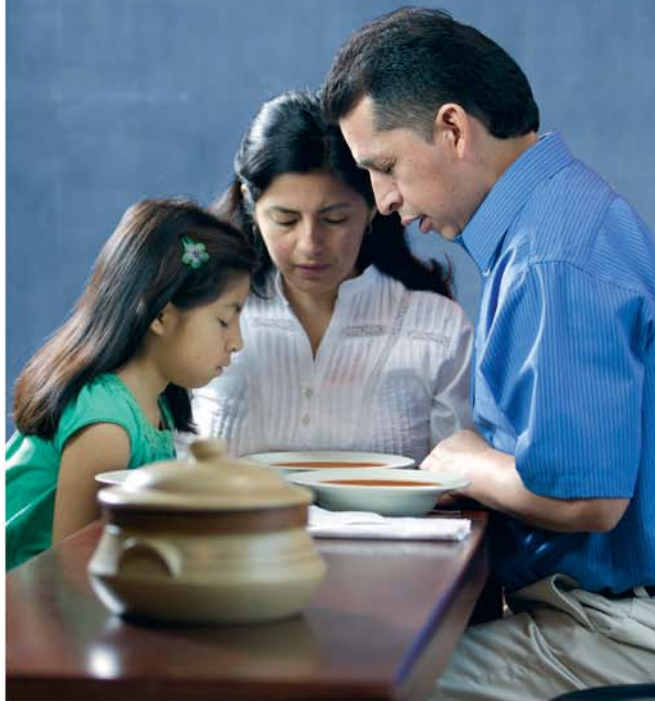
Hvordan styrker bønn vårt vennskap med Gud? (Se avsnitt 21)

20, 21. Hvilken trøst gir Paulus' ord i Filipperne 4:6, 7?