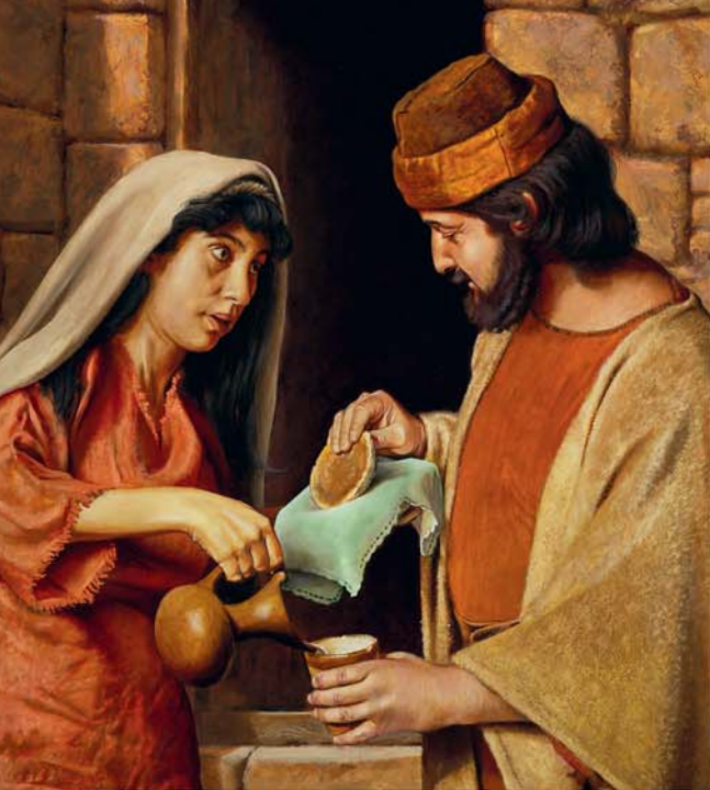
Enkens tro på Elias Gud, Jehova, gjorde at hun og sønnen hennes overlevde

han: «Vær snill og hent en bit brød til meg i din hånd.» (1. Kong 17:10, 11) Å gi den fremmede noe å drikke var ikke vanskelig, men å gi ham brød var et stort problem.