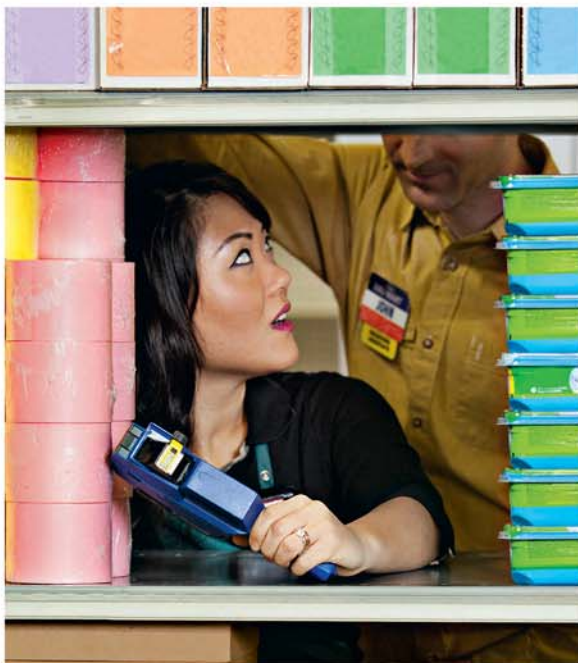
Mety ho voatarika hanitsakitsa-bady ny olona iray, raha manadaladala olona, na manaiky hadaladalain'ny olona

ny toe-javatra mety hahatonga anao hiraiki-po amin'ny olona tsy vadinao, rehefa any am-piasana, na any an-toeran-kafa. Mety ho tratran'ny fakam-panahy, ohatra, ny lehilahy sy vehivavy, raha miara-miasa akaiky ivelan'ny ora fiasana. Raha lehilahy na vehivavy manambady ianao, dia aseho mazava tsara amin'ny alalan'ny teninao sy ny fihetsikao, fa tsy afaka miaraka amin'olona ankoatra ny vadinao ianao. Olona mahafy tena ho an'Andriamanitra koa ianao, ka azo inoana fa tsy ho ianao indray no hijejojejo amin'ny olona na hihaingo amin'ny fomba tsy maotina, mba hisarihana ny sain'ny hafa. Azonao asiana sarin'ny vady aman-janakao koa ao amin'ny toeram-piasanao. Izany no hampahatsiahy anao sy ny hafa, fa tianao ny ankohonanao. Aoka ianao ho tapa-kevitra handa an-kitsirano, rehefa misy olona mitady hanangoly anao.'