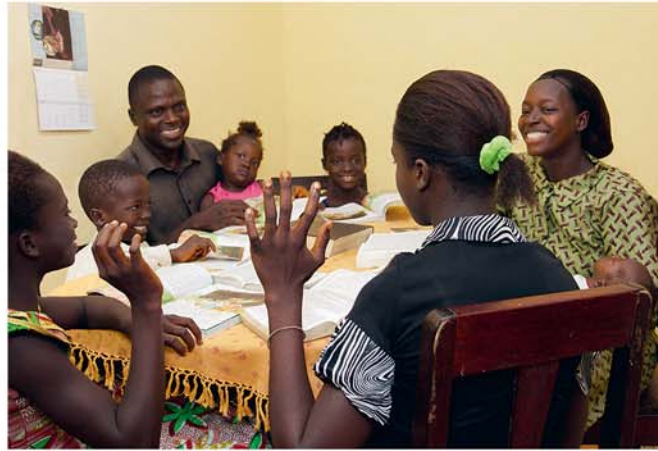
Ho tena vahoakan'ilay Fanjakana ianao sy ny fianakavianao raha manao Fotoam-pivavahan'ny Fianakaviana

15. Inona no tombontsoa lehibe ananantsika?