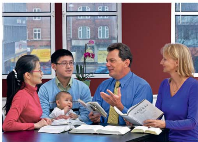
Sarobidy amin’i Jehovah ny ezaka ataonao, mba hampielezana ny “tena fahalalana” an’Andriamanitra

16. Nahoana no nataon’i Jehovah nitombo be ny “tena fahalalana”?