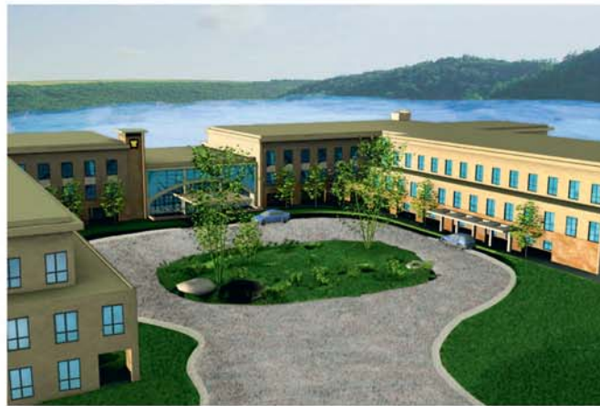
Sarin'ny trano kasaina haorina any Warwick, any New York, mba hatao foiben'ny Vavolombelon'i Jehovah