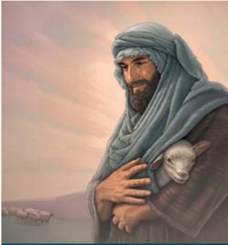
Ritorna a Geova