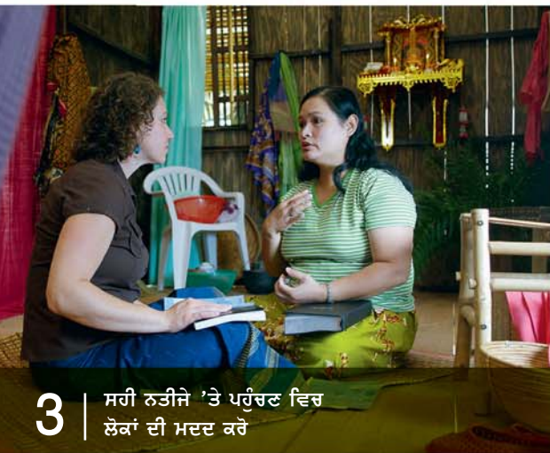
3 ਸਹੀ ਨਤੀਜੇ 'ਤੇ ਪਹੁੰਚਣ ਵਿਚ ਲੋਕਾਂ ਦੀ ਮਦਦ ਕਰੋ

ਜਾਣਨ ਲਈ ਉਸ ਨੂੰ ਸਵਾਲ ਪੁੱਛੋ? ਤੁਸੀਂ ਇਹ ਕਿਵੇਂ ਕਰ ਸਕਦੇ ਹੋ?