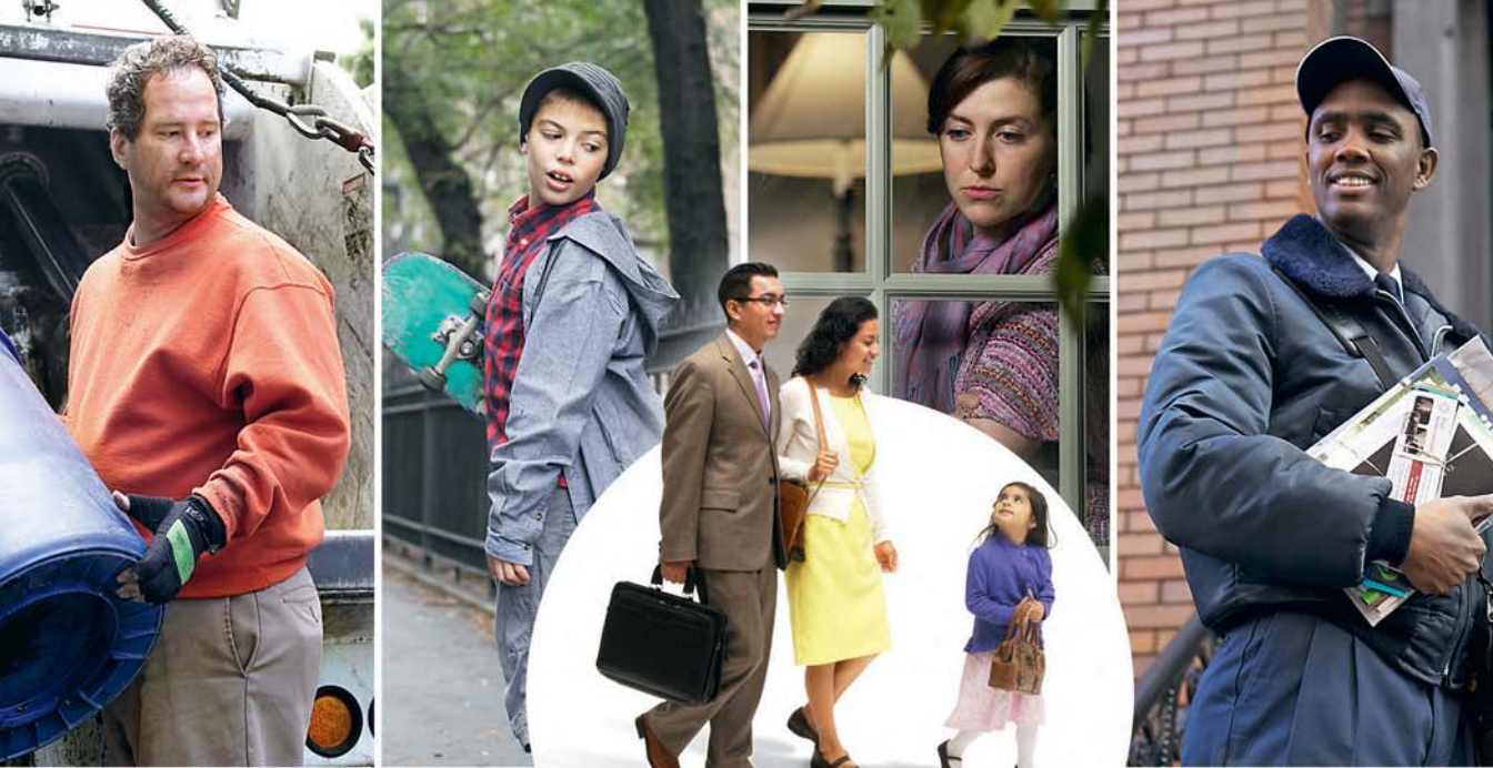
ਸਾਨੂੰ ਪ੍ਰਚਾਰ ਕਰਦਿਆਂ ਦੇਖ ਕੇ ਹੀ ਲੋਕਾਂ ਨੂੰ ਵੱਡੀ ਗਵਾਹੀ ਮਿਲਦੀ ਹੈ

ਹੈ, ਪਰ ਅਸੀਂ ਕੁਰਬਾਨੀਆਂ ਕਰਨ ਲਈ ਤਿਆਰ ਹਾਂ। ਇਨ੍ਹਾਂ ਤੋਂ ਯਹੋਵਾਹ ਦੀ ਵਡਿਆਈ ਹੁੰਦੀ ਹੈ।—ਰੋਮੀ. 12:1.