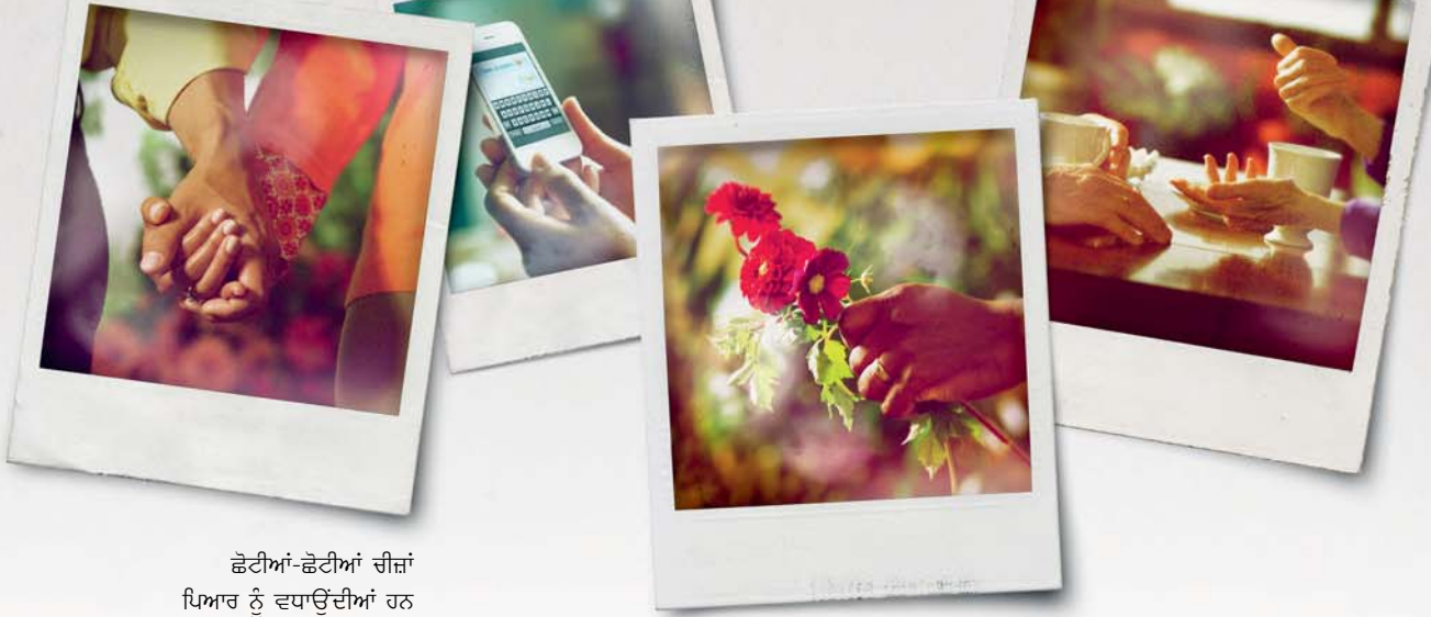
ਛੋਟੀਆਂ-ਛੋਟੀਆਂ ਚੀਜ਼ਾਂ ਪਿਆਰ ਨੂੰ ਵਧਾਉਂਦੀਆਂ ਹਨ

ਨਹੀਂ ਹੈ। ਜਦ ਮੇਰੇ ਲਈ ਗੱਲ ਕਰਨੀ ਔਖੀ ਹੁੰਦੀ ਹੈ, ਤਾਂ ਮੈਂ ਪ੍ਰਾਰਥਨਾ ਕਰਦਾ ਹਾਂ ਕਿ ਯਹੋਵਾਹ ਸਹੀ ਲਫਜ਼ ਕਹਿਣ ਵਿਚ ਮੇਰੀ ਮਦਦ ਕਰੇ ਤੇ ਮੈਂ ਸਹੀ ਢੰਗ ਨਾਲ ਆਪਣੀ ਗੱਲ ਕਹਿ ਸਕਾਂ। ਫਿਰ ਮੈਂ ਲੰਬਾ ਸਾਹ ਲੈ ਕੇ ਗੱਲ ਕਰਨੀ ਸ਼ੁਰੂ ਕਰਦਾ ਹਾਂ।” ਇਹ ਵੀ ਜ਼ਰੂਰੀ ਹੈ ਕਿ ਪਤੀ-ਪਤਨੀ ਸਹੀ ਮਾਹੌਲ ਦੇਖ ਕੇ ਗੱਲਬਾਤ ਕਰਨ। ਸ਼ਾਇਦ ਉਹ ਇਕੱਠੇ ਬਾਈਬਲ ਜਾਂ ਹਰ ਰੋਜ਼ ਬਾਈਬਲ ਦੀ ਜਾਂਚ ਕਰੋ ਕਿਤਾਬ ਪੜ੍ਹਦੇ ਹੋਏ ਗੱਲਬਾਤ ਕਰ ਸਕਦੇ ਹਨ।