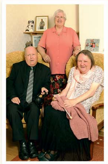
ਅਸੀਂ ਯਹੋਵਾਹ ਦਾ ਲੱਖ-ਲੱਖ ਸੁਕਰ ਕਰਦੇ ਹਾਂ ਕਿ ਉਸ ਨੇ ਸਾਨੂੰ ਆਪਣੇ ਬਚਨ ਵਿੱਚੋਂ ਸੱਚਾਈ ਸਿਖਾਈ ਹੈ!

ਅਸੀਂ ਯਹੋਵਾਹ ਦਾ ਲੱਖ-ਲੱਖ ਸੁਕਰ ਕਰਦੇ ਹਾਂ ਕਿ ਉਸ ਨੇ ਸਾਨੂੰ ਆਪਣੇ ਬਚਨ ਵਿੱਚੋਂ ਸੱਚਾਈ ਸਿਖਾਈ ਹੈ! ਅਸੀਂ ਮੰਡਲੀ ਦੇ ਭੈਣਾਂ-ਭਰਾਵਾਂ ਦਾ ਵੀ ਸੁਕਰੀਆ ਅਦਾ ਕਰਦੇ ਹਾਂ ਜਿਨ੍ਹਾਂ ਦੀ ਮਦਦ ਨਾਲ ਅਸੀਂ ਯਹੋਵਾਹ ਦੀ ਸੇਵਾ ਵੱਧ-ਚੜ੍ਹ ਕੇ ਕਰ ਪਾਏ ਹਾਂ। ਸਭ ਤੋਂ ਵਧ ਅਸੀਂ ਯਹੋਵਾਹ ਦੀ ਮਦਦ ਸਦਕਾ ਮੁਸ਼ਕਲਾਂ ਦੇ ਬਾਵਜੂਦ ਖੁਸ਼ ਰਹਿ ਸਕੇ ਹਾਂ।