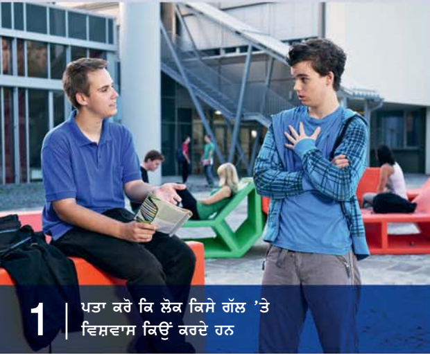
1 ਪਤਾ ਕਰੋ ਕਿ ਲੋਕ ਕਿਸੇ ਗੱਲ 'ਤੇ ਵਿਸ਼ਵਾਸ ਕਿਉਂ ਕਰਦੇ ਹਨ