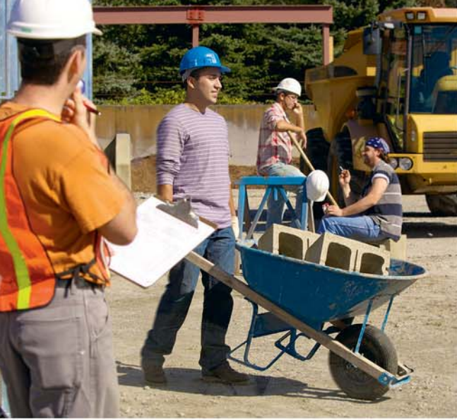
ਲੋਕ ਤੁਹਾਡੀ ਬੀਮਾਨਦਾਰੀ ਅਤੇ ਮਿਹਨਤ ਨੂੰ ਦੇਖਦੇ ਹਨ

ਭੈਣ ਕੋਲ ਆਇਆ ਤੇ ਪੁੱਛਣ ਲੱਗਾ, “ਕੀ ਤੁਸੀਂ ਸੈਂਨੂੰ ਪਛਾਣਿਆ? ਮੈਂ ਉਹੀ ਬੱਸ ਡਰਾਈਵਰ ਹਾਂ ਜਿਸ ਨੇ ਤੁਹਾਡੇ ਨਾਲ ਗੱਲ ਕੀਤੀ ਸੀ। ਉਸ ਦਿਨ ਤੁਹਾਡੀ ਬੀਮਾਨਦਾਰੀ ਦੇਖ ਕੇ ਮੈਂ ਯਹੋਵਾਹ ਦੇ ਗਵਾਹਾਂ ਨਾਲ ਬਾਈਬਲ ਸਟੱਡੀ ਕਰਨ ਦਾ ਫੈਸਲਾ ਕੀਤਾ।” ਸਾਡੀ ਬੀਮਾਨਦਾਰੀ ਦੇਖ ਕੇ ਲੋਕ ਸ਼ਾਇਦ ਖੁਸ਼ ਖਬਰੀ ਸੁਣਨ ਲਈ ਤਿਆਰ ਹੋ ਜਾਣ।