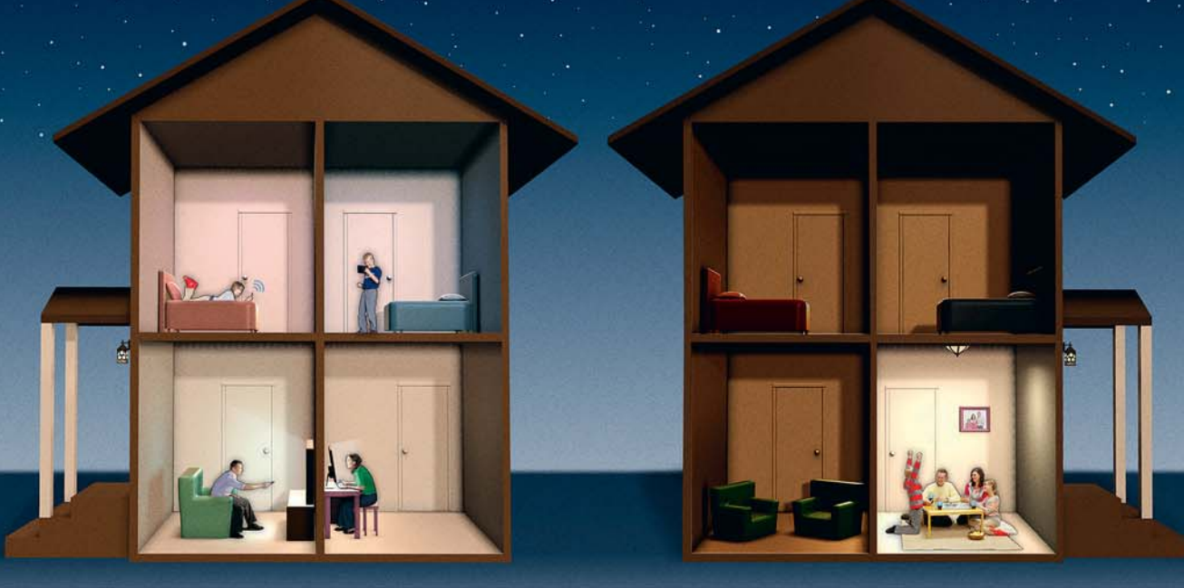
ਘਰ ਵਿਚ ਕਿਸੇ ਵੀ ਚੀਜ਼ ਨੂੰ ਗੱਲਬਾਤ ਕਰਨ ਵਿਚ ਰੁਕਾਵਟ ਨਾ ਬਣਨ ਦਿਓ

ਸਨ। ਇੱਦਾਂ ਮਾਪਿਆਂ ਤੇ ਬੱਚਿਆਂ ਕੋਲ ਇਕੱਠੇ ਰਹਿਣ ਅਤੇ ਗੱਲਬਾਤ ਕਰਨ ਦਾ ਬਥੇਰਾ ਸਮਾਂ ਹੁੰਦਾ ਸੀ। ਇਸ ਕਰਕੇ ਮਾਪੇ ਆਪਣੇ ਬੱਚਿਆਂ ਦੀਆਂ ਲੋੜਾਂ, ਇੱਛਾਵਾਂ ਤੇ ਸੁਭਾਅ ਨੂੰ ਚੰਗੀ ਤਰ੍ਹਾਂ ਜਾਣ ਸਕਦੇ ਸਨ। ਨਾਲੇ ਬੱਚੇ ਵੀ ਆਪਣੇ ਮਾਪਿਆਂ ਨੂੰ ਚੰਗੀ ਤਰ੍ਹਾਂ ਜਾਣ ਸਕਦੇ ਸਨ।