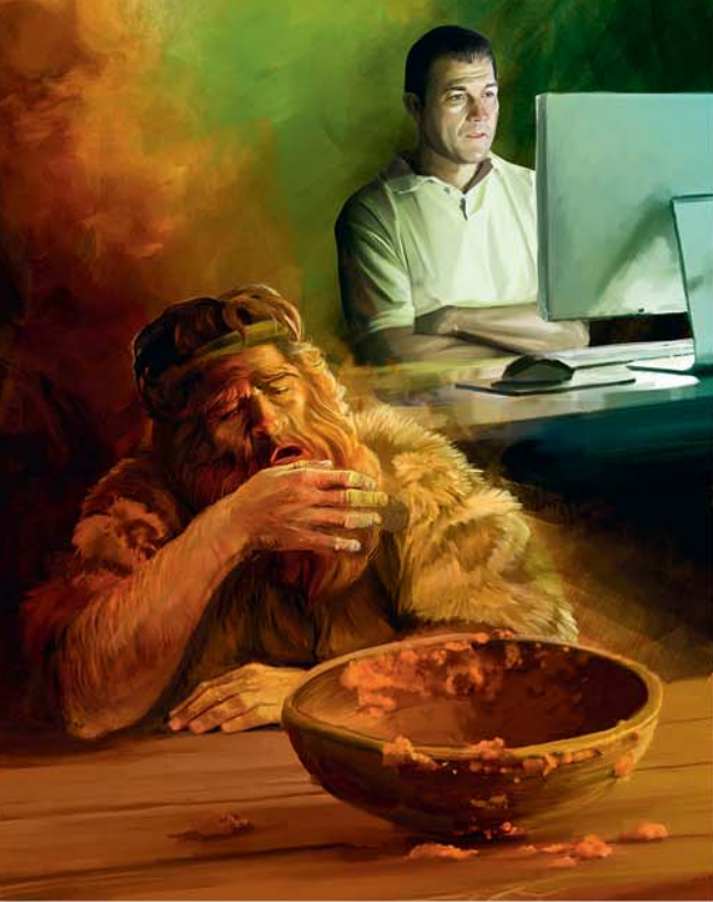
ਆਪਣੀ ਵਿਰਾਸਤ ਨੂੰ ਦਾਅ 'ਤੇ ਨਾ ਲਾਓ

ਦੀ ਬਰਕਤ ਪਾਉਣ ਨਾਲੋਂ ਉਸ ਲਈ ਆਪਣੇ ਸਰੀਰ ਦੀਆਂ ਇੱਛਾਵਾਂ ਪੂਰੀਆਂ ਕਰਨੀਆਂ ਜ਼ਿਆਦਾ ਜ਼ਰੂਰੀ ਸਨ। ਉਸ ਨੇ ਆਪਣੇ ਜੇਠੇ ਹੋਣ ਦੇ ਹੱਕ ਦੀ ਕੋਈ ਕਦਰ ਨਹੀਂ ਕੀਤੀ ਤੇ ਉਸ ਦੇ ਦਿਲ ਵਿਚ ਪਰਮੇਸ਼ੁਰ ਲਈ ਕੋਈ ਪਿਆਰ ਨਹੀਂ ਸੀ। ਨਾਲੇ ਉਸ ਨੇ ਇਹ ਵੀ ਨਹੀਂ ਸੋਚਿਆ ਕਿ ਇਸ ਫੈਸਲੇ ਦਾ ਉਸ ਦੇ ਬੱਚਿਆਂ 'ਤੇ ਕੀ ਅਸਰ ਪਵੇਗਾ। ਇਸ ਤੋਂ ਉਲਟ ਯਾਕੂਬ ਨੇ ਆਪਣੀ ਵਿਰਾਸਤ ਦੀ ਦਿਲੋਂ ਕਦਰ ਕੀਤੀ। ਮਿਸਾਲ ਲਈ, ਯਾਕੂਬ ਨੇ ਵਿਆਹ ਬਾਰੇ ਵੀ ਆਪਣੇ ਮਾਪਿਆਂ ਦੀ ਸਲਾਹ ਮੰਨੀ। (ਉਤ. 27:46-28:3) ਹਾਲਾਂਕਿ ਇੰਦਾਂ ਕਰਨ ਲਈ ਉਸ ਨੂੰ ਧੀਰਜ ਰੱਖਣਾ ਪਿਆ ਅਤੇ ਕੁਰਬਾਨੀਆਂ ਕਰਨੀਆਂ ਪਈਆਂ, ਪਰ ਅਖੀਰ ਵਿਚ ਉਸ ਨੂੰ ਯਹੋਵਾਹ ਨੇ ਬਰਕਤ ਦਿੱਤੀ ਤੇ ਮਸੀਹ ਉਸ ਦੀ ਪੀੜ੍ਹੀ ਵਿੱਚੋਂ ਆਇਆ। ਇਨ੍ਹਾਂ ਦੋਵਾਂ ਤਰਾਵਾਂ ਬਾਰੇ ਯਹੋਵਾਹ ਦਾ ਕੀ ਨਜ਼ਰੀਆ ਸੀ? ਪਰਮੇਸ਼ੁਰ ਨੇ ਮਲਾਕੀ ਨਬੀ ਰਾਹੀਂ ਲਿਖਵਾਇਆ: “ਮੈਂ ਯਾਕੂਬ ਨੂੰ ਪਿਆਰ ਕੀਤਾ ਪਰ ਏਸਾਓ ਨਾਲ ਵੈਰ ਰੱਖਿਆ।”—ਮਲਾ. 1:2, 3.