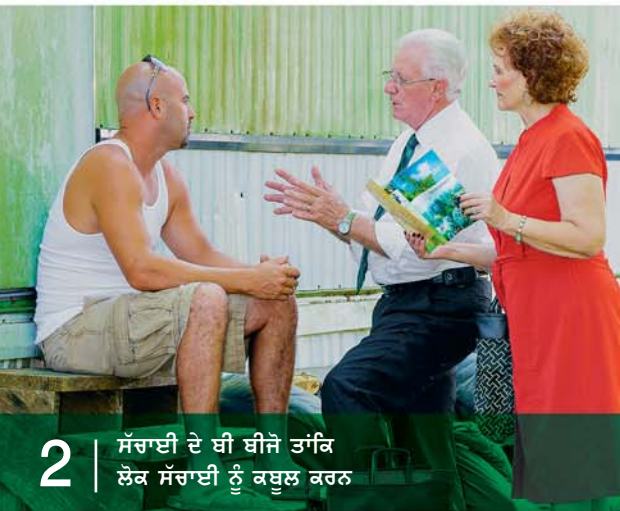
2 ਸੱਚਾਈ ਦੇ ਬੀ ਬੀਜੇ ਤਾਂਕਿ ਲੋਕ ਸੱਚਾਈ ਨੂੰ ਕਬੂਲ ਕਰਨ