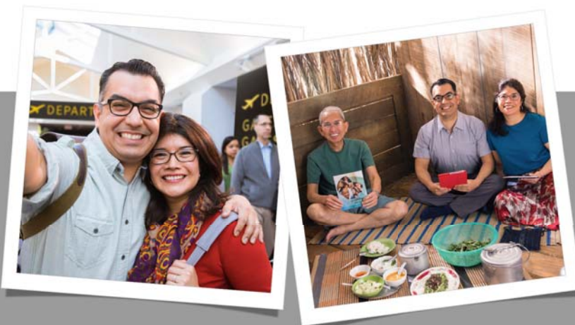
O suiga e le’i faatalitalia e mafai ona i’u atu i faamanuiaga e le’i faatalitalia (Taga’i i palakalafa e 19-21)

22. O le ā e tatou te mautinoa i ai pe a tatou taumafai e faia le mea sili e tusa ai ma o tatou tulaga?