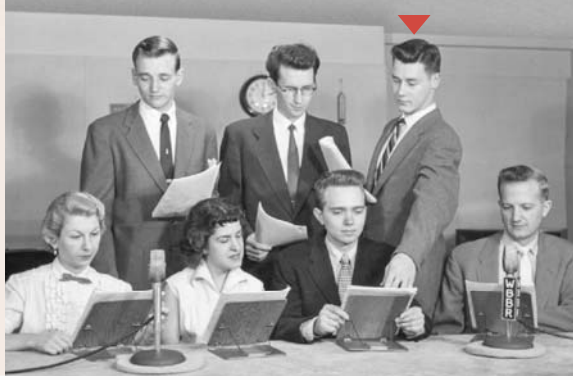
Sauni e pu'e se polokalame i le leitiō o le WBBR