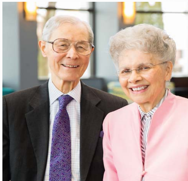
O i ma'ua ma Lila i le taimi lenei

O se fiafiaga tele iā te a'u le iai i totonu o le faalapotopotoga mata'ina a Ieova, ma mātāu le telē o le eseese o le e auauna iā Ieova, ma lē e lē auauna iā te ia. Ua tatou malamalama lelei i le uiga o le Malaki 3:18: “O le a outou toe iloa ai lava le eseese o le tagata amiotonu ma le tagata amioleaga, o le eseese fo'i o le o loo auauna i le Atua ma lē e lē o auauna iā te ia.” A o faagasolo aso ta'itasi, e tatou te vaaia le faateteleina o le tulaga leaga o le faiga o mea a Satani, lea e tumu i tagata e leai se faamoemoe ma faanoanoa. Peita'i, e fiafia ē e alolofa ma auauna iā Ieova e ui o loo ola i nei aso e sili ona faigatā, ma e iai lo latou faamoemoe pupula. Ma'eu se faaeaga ua tatou maua e folafola atu le tala lelei o le Malo! (Mata. 24:14) O loo tatou tulimata'ia le taimi o le a faaumatia ai e le Malo o le Atua lenei lalolagi tuai, ma aumaia le lalolagi fou faatasi ai ma le anoanoa'i o faamanuiaga, e aofia ai le soifua mālōlōina lelei atoatoa, ma le ola e faavavau. Ua toe o se aga ona tatou 'ae'ae lea i na faamanuiaga. O le taimi lenā o le a maua ai e auauna faamaoni a Ieova le ola e faavavau i le lalolagi fou.