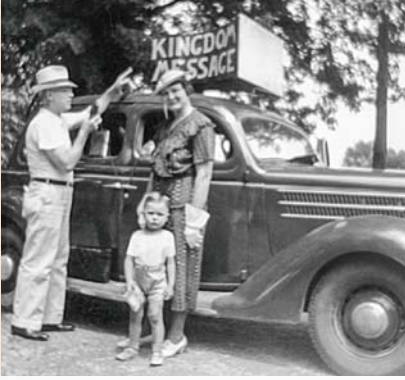
O i matou ma o'u mātua i luma o la matou taavale faasalalau