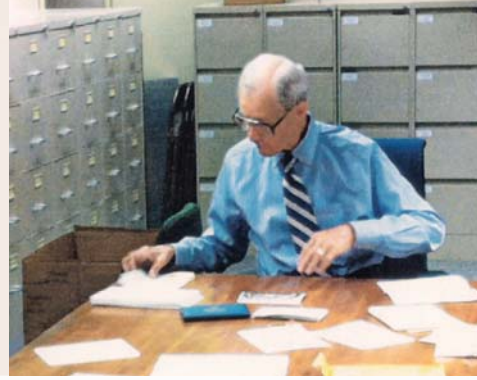
Faamaopoopo tusipasi o le A'oga o Kiliata a o le'i faia se faauuga

Ioka e aga'i i Hamburg i Siamani, ina ia auai i lenā tauaofiaga. Ina ua mǎe'a le tauaofiaga, na totogi la matou taavale ma isi uso e to'atolu mai i le Peteli. Na matou ō i le taavale mai i Siamani e aga'i i Italia, ina ia asia le ofisa o le lālā i Roma. Na matou ō fo'i i Falani ma ui atu i atumauga o Pyrenees, ma aga'i atu i Sepania lea na faasā ai le galuega tala'i. Na mafai ona matou ō ma ave ni nai lomiga i uso i Barcelona, lea na afi'i pepa faapitoa ina ia foliga atu o ni meaalofa. O se fialiaga iā i matou le feiloa'i ma na uso. Na matou aga'i i Amsterdam, ma pu'e ai le vaalele e toe fo'i i Niu Ioka.