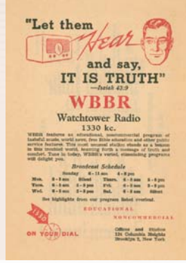
E matou te tufatufaina pepa e faalauiloa ai le WBBR i le tala'iga

lauga faale-Tusi Paia ua uma ona pu'eina. Pe a uma ona tā le lauga, ona matou ofoina lea o lomiga i tagata fiafia.