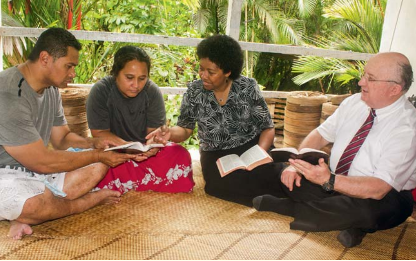
Ko maua ko Loraini e tutu aere ra i Viti

uruaanga. Inara i te aiai i to matou tae anga, kua akamata i te ua maata. No reira kua raveia ta matou uruaanga! Iaku uorai, e āka akameitakianga tikai kia piri ki roto i te tuku anga i te New World Translation of the Christian Greek Scriptures i te reo Tuvalu! Noatu e e meangiti ua te numero o te au taeake e tuatua ra i te reira reo, ka rauka katoa ia ratou teia apinga aroa manea mei ia Iehova. E oti, i te openga o te uruaanga kua maata akaou te ua! No reira kua rauka i te katoatoa te vai o te tuatua mou pera katoa e maata te vai no te ua.