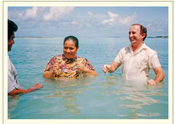
Papetitoanga i tetai vaine i roto i te tai