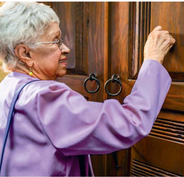
Te tutu maroiroi ra ainei koe i te tuatua meitaki? (Akara i te parakarapa 15)

12 Kua tiaki marie te peroveta ko Habakuka iaia e tutu aere ra no runga i te akapou anga o Ierusalem. Kua tutu katoa tetai au peroveta i mua ake iaia i taua karere ra no te au mataiti e manganui. Te kite atura a Habakuka e ka kino rava atu te tu kino e te tu tau kore. Kua pati akatenga aia kia Iehova no te tauturu, i te na ko anga e: “Mei te aa te roa, e Iehova, o toku kapiki anga?” Noatu e kare a Iehova i akakite ana e aea te openga e tae mai ei, kua taputou aia kia Habakuka: “E tae tika mai ia, e kare e tavarevare.” Kua akakite katoa a Iehova kia Habakuka e kia “tapapa atu rai.” — E tatau ia Habakuka 1:1-4; 2:3.