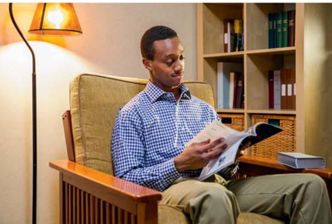
Kia mareka ua i te au mea ta Iehova i oronga mai naau