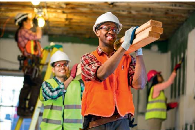
Tutu maroiroi i te tuatua meitaki