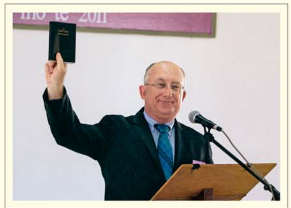
Oronga anga i te New World Translation of the Christian Greek Scriptures i te reo Tuvalu