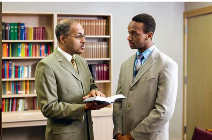
Kimi i te au aratakianga i roto i te Pipiria

toou oraanga i te tavini anga ia Iehova. Eaa ka kore ei e rave i tetai au kimikimi anga i roto i ta tatou au puka no runga i te au tu tavini anga tamou tukeke? Ka rauka ia koe i te akanoo i tetai o teia au akakoroanga.* (Akara i te tataanga rikiriki i raro ake.) E tuatua atu ki tetai pae tei tavini tamou ana ia Iehova no te au mataiti e manganui. Me taangaanga koe i toou oraanga i te tavini ia Iehova, ka rauka ia koe te au terenianga puapinga tikai. Ka riro teia tupuanga ei tauturu ia koe kia tavini ia Iehova i roto i te ao ou.