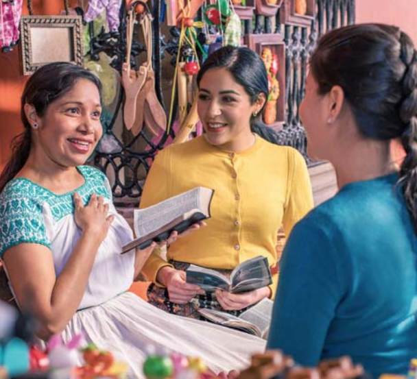
Ба одамони самими барои фаҳмидани ҳақиқат ёри расондан хеле хурсандиовар аст (Ба сархати 12 нигаред.)

беҳбудии ҳар як офаридаи худро хоҳон аст, Одаму Ҳавво низ бояд оиди хушбахтии фарзандонашон, ки ҳоло ба дунё наомада буданд, фикр мекарданд. Яхува интизор буд, ки Одаму Ҳавво бо насли афзудаистодаи худ ҳамкорӣ карда, тамоми заминро ба биҳишт табдил диҳанд. Ин дар ҳақиқат кори бузурге буд!