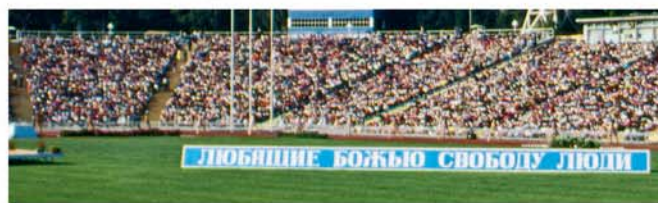
Congreso na Odessa na 1991

Diahuebs dia 22 di augustus, dos dia prome cu e congreso mester a cuminsa, e miembronan di e Comité di Congreso a bin bek cu bon noticia: Nos a haya luz berde pa e congreso sigui! Ora nos a canta