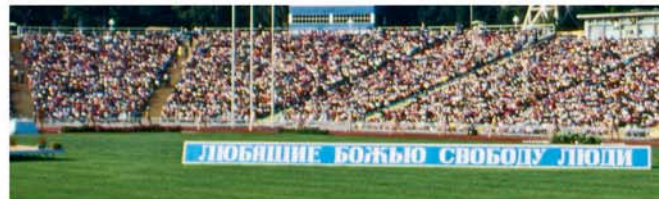
Congreso na Odessa na 1991

Diahuebs dia 22 di augustus, dos dia prome cu e congreso mester a cuminsa, e miembronan di e Comite di Congreso a bin bek cu bon noticia: Nos a haya luz berde pa e congreso sigui! Ora nos a canta