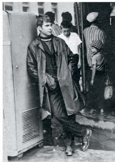
Na stacion di trein di Dzhankoy, rond di año 1974

Tempo mi tabatin nueve año, autoridadnan a deporta mi famia y cientos di otro Testigo di Jehova di Moldova pa Siberia. Dia 6 di juli 1949, nan a prop nos den wagon pa transporta bestia. Despues di un biahe di 12 dia y mas cu 6.400 kilometer nos a yega na e stacion di trein na Lebyazhe. Ey autoridadnan local tabata warda riba nos. Nan a parti nos den diferente grupo chikito y a manda nos mesora na diferente luga den e area ey. Nos grupo a haya alohamento den un scol chikito cu tabata bashi. Nos tabata cansa y desanima. Un señora di edad cu tabata hunto cu nos a cuminsa neurie (hum) un cantica cu Testigonan di Jehova a compone durante Segundo Guera Mundial. Un poco despues nos tur a cuminsa canta hunto cu ne e palabranan di e cantica: