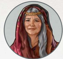
Sala Kõnu mujêê mii