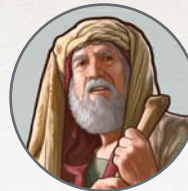
Abahamu Di Tata u te a hia sêmbê

Kumafa di në u de bi kê taki, nõö Abahamu bi ko dē di tata u sômëni nasiön, nõö Sala bi ko dē di avo u sômëni kõnu.