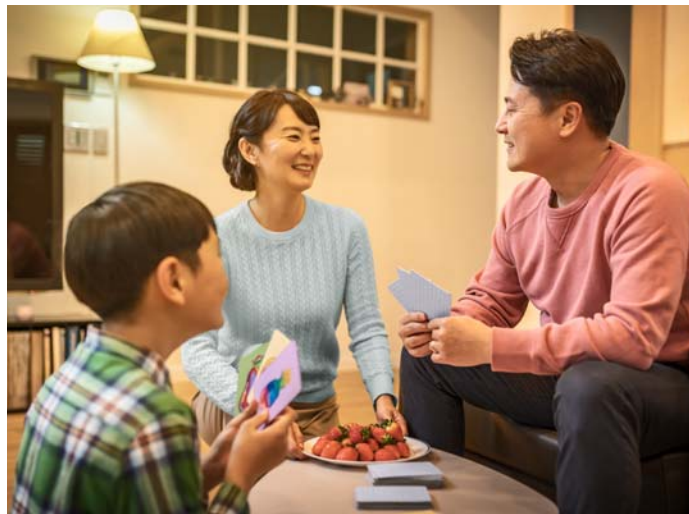
O lou tigā alofa ma lau amio o se molimau sili lea e mafai ona e avatu (Taga'i i palakalafa 6-8)