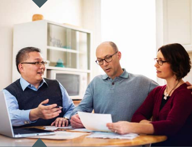
Avatu se fesoasoani talafeagai (Taga'i i le palakalafa e 13)