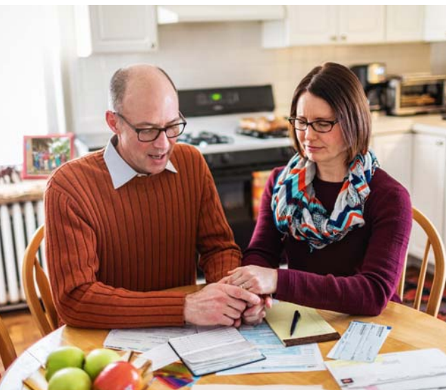
E tāua lo tatou mafuta vavalalata iā Ieova ma maufaatuatuaina o ia (Taga'i i palakalafa e 6-7)

popolega o le lalolagi a Satani, ma itu e “fentina’iina” ai au gaoioiga faaleagaga. (Mata. 13:22) Ia teena omiga mai i le lalolagi, po o uō ma tauaiga ina ia sa’ili le tele o le tamaoiga i lenei faiga o mea a Satani. (Faitau le 1 Ioane 2:15-17.) Ia maufaatuatuaina Ieova, o lē ua folafola mai e na te saunia mea e faamalieleina ai o tatou mana’oga faaleagaga, tau faalogona ma le faaletino “i le taimi e tatau ai.”—Epe. 4:16; 13:5, 6.