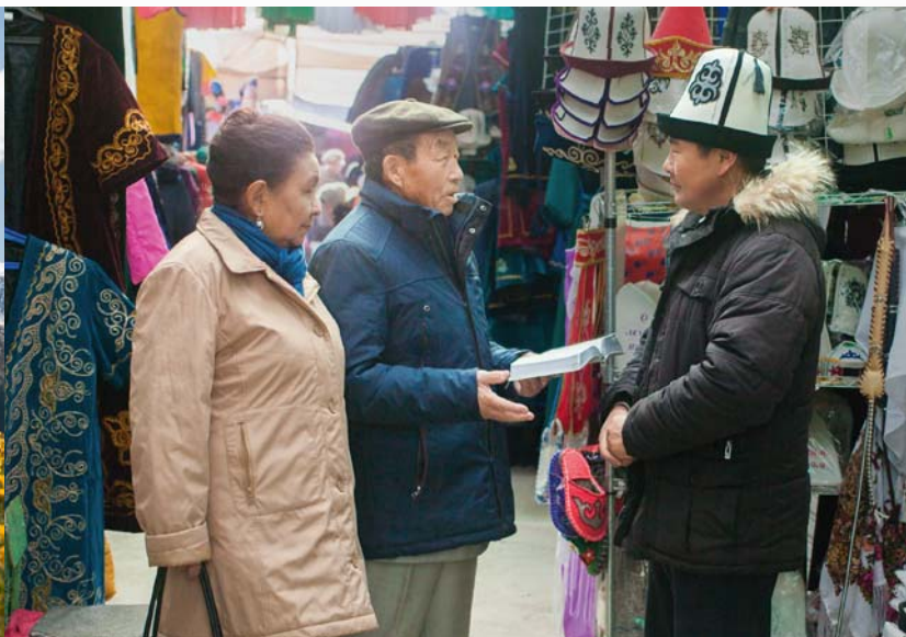
Com a minha esposa na pregação