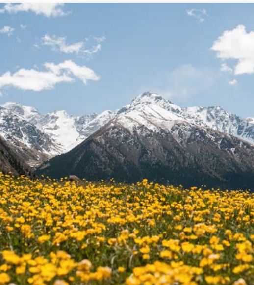
As montanhas Teskey Ala-Too

Jeová também transformou a minha vida. Eu cresci numa família simples de agricultores e frequentei a escola durante cinco anos. Mesmo assim, tornei-me ancião e Jeová usou-me para ensinar as verdades da Bíblia a pessoas que eram muito mais instruídas do que eu. Realmente, Jeová pode fazer acontecer coisas que parecem impossíveis. A minha experiência motiva-me a continuar a falar a outros sobre Jeová, o Deus para quem “todas as coisas são possíveis”. — Mat. 19:26.