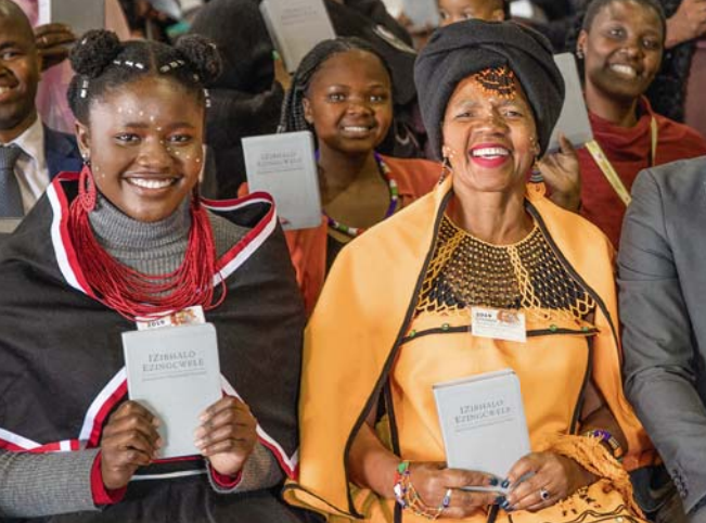
Aune 2019 kjeem de Neue-Welt-Übersetzung opp Kjoosa rut. Nu jeft et dee aul opp äwa 180 Sproaken – entwäda gaunz ooda jewesse Poat

ne Kjinja oppe leed bekjemmat wia. Doabennen finj wie de Auntwuaten fa de wichtigste Froagen , waut et jeft, biejlík: Von wua kom wie? To waut läw wie? Un waut woat lota noch mol sennen? Jehova well, daut aul siene Kjinja daut weeten kjennen. Doawäajen kjeem hee doafäa opp, daut de Schreft met de Tiet opp een deel Sproaken äwasat wort. Vondoag dän Dach jeft et de gaunze Bibel ooda jewesse Poat doavon opp mea aus 3000 Sproaken! Sest kjeen Buak es soo wiet vebreet un soo foaken äwasat. De mieschte Menschen kjen-