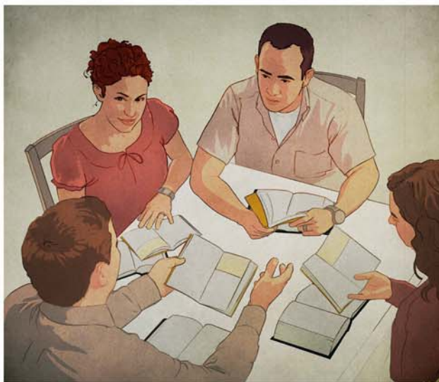
Nira vulica na iVolatabu e levu na tagane, e sa vukei ira mera veisautaka na nodra ivakarau ni bula

Troy: Ke dau kaukaua na nomu vosa se voravora nomu ivalavala vei ratou e vale, ena vinakati mo cakava kina e dua na ka. E levu na ka e rawa ni vukei iko. Ia au mudu-