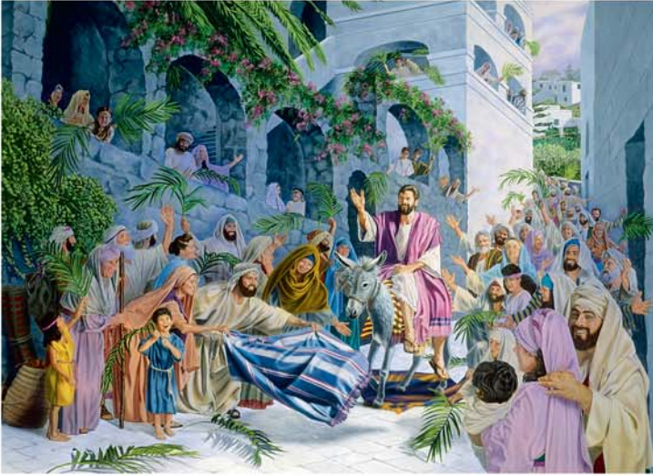
Yesuusi bonchuan Yerusalaame gelidoogan polettida hiraagay awugee?

gidiis. Hagee GODAI oottidobaa.” (Maz. 118: 22, 23) Yesuusi bana ixxiya, haymaanoottiya kaalettiyaageeti, ha xiqisiyaa hassayanaadan yootiis; PHeexiroosi qassi, hegee Kiristtoosa bolla polettidoogaa yootiis. (Mar. 12:10, 11; Oos. 4:8-11) Yesuusi Kiristaane gubaa'iyau 'goda xaphuwaa minttiya shuchcha gidiis.' Xoosaa dosenna asay a ixxidaba gidikkokka, “Xoosaa matan i doorettida al77o.”—1 PHe. 2:4-6.