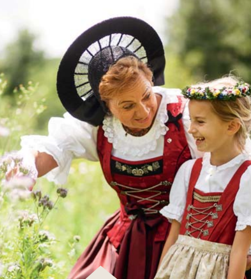
Vêtements traditionnels colorés.