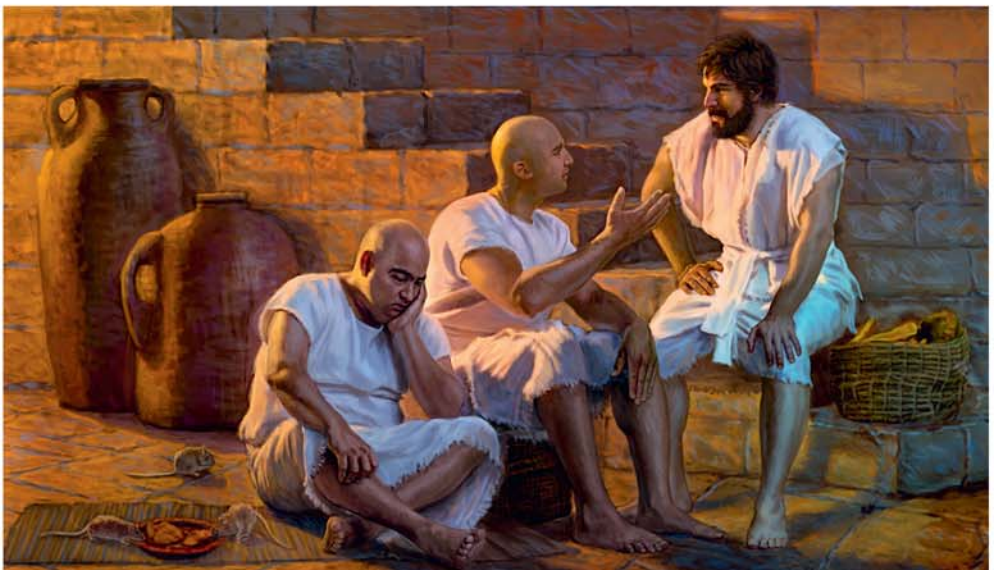
Yozefi sadilaka bantu ya boloko mambu na mawete mpi na luzitu

Bilumbu tatu na nima, mambu yina Yozefi tubaka