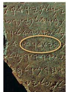
HUC Tai Dan Excavations

Eric: Ee, mono me bakisa. Verse yango ke tuba