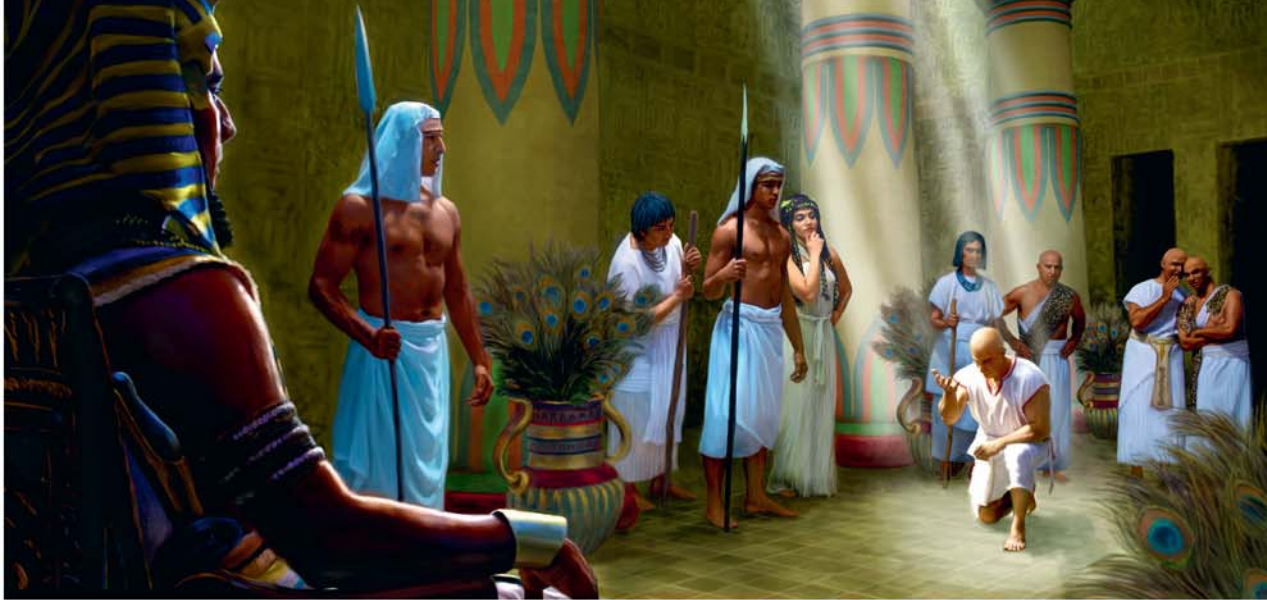
Yozefi zabisaka Farao na kudikulumusa yonso nde: “Mono ve!”

Farao vandaka na mfunu ya “muntu mosi ya mayele” sambu na kutula bambuma yonso ya insi na banzo ya kubumba bambuma na nsungi ya bamvula nsambwadi ya mbote mpi sambu na kukabula bambuma yango na nsungi ya nzala. (Kuyantika 41:33-36) Nzayilu mpi makuki ya Yozefi monisaka nde yandi fwanaka na kusala kisalu yina, kansi yandi kudikulumusa, dibanza ya kudikumisa kwisilaka yandi ve ata fioti mpi lukwikilu na yandi salaka nde kisika yai ya lukumu kumonana kima mosi ya mpamba. Kana beto ke monisa mpenza lukwikilu na Yehowa, beto ta sosa ve lukumu mpi ta kudinangula ve. Beto ta vanda na ngemba kana beto bika mambu na maboko ya Nzambi!