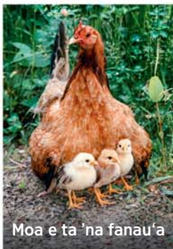
Moa e tā 'na fanau'a