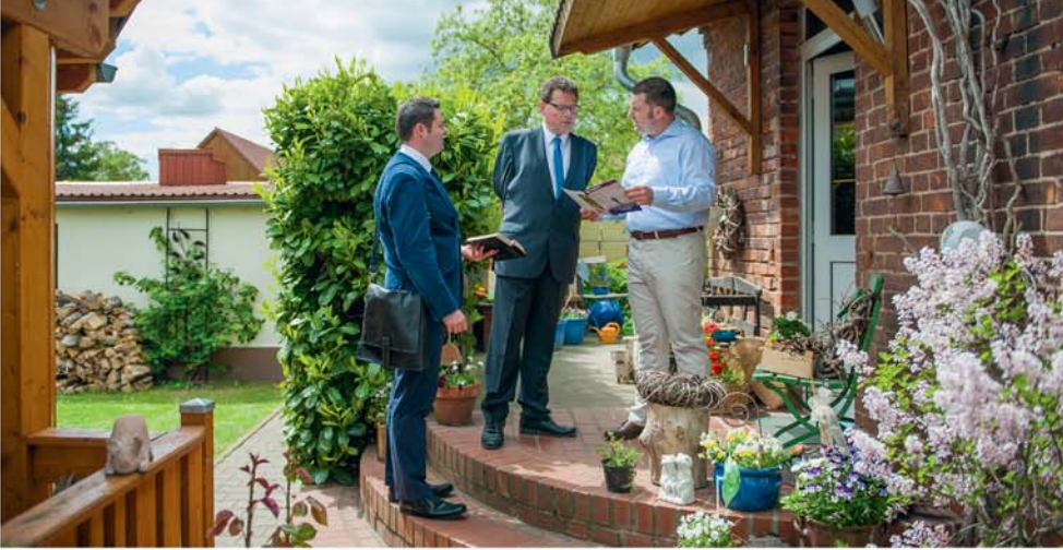
Oaoa vau i te faaite i te parau apī maitai i te tahi atu

A taurearea 'i, mea au na 'u te mau buka no nia i te mau tao'a feruri-noa-hia. I te tahi taime, i feruri na vau e fana'o i te rima matini no te rave i te mau mea atoa. I te 14raa o to 'u matahiti, ua haamata vau i te puhipuhi i te avaava. No 'u, e horoa mai te reira i te tahi tiaturi ia 'u iho. E ere ia vau i te hoê taata taa ê i te tahi atu. Mai te huru ra e e parau vau: 'E tae atoa ia 'u ia na reira. E taata paari te feia puhipuhi avaava, e rima to ratou aore ra aita.'