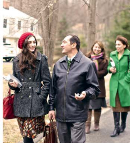
GID zot lo zot semen (Vwar paragraf 13-18)

e trouv en konzwen. Sa in ed mwan pour santi mwan konfortab pour koz avek zot lo la. Anfet, mon anvî enplik zot dan nenport relasyon ki mon annan dan plas kasyet li avek zot.”