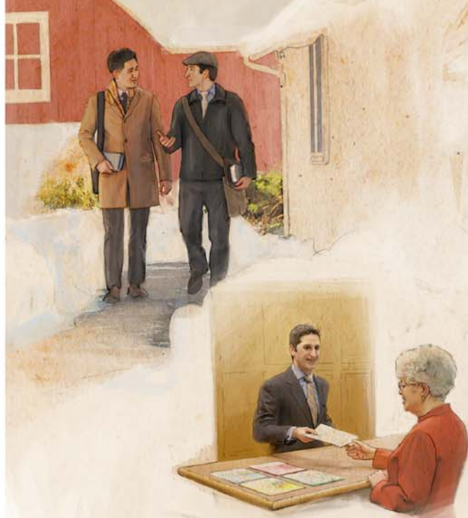
Anmezir ki ou “swete” desarz plis responsabilite dan kongregasyon partisip dan diferan fason dan aktivite kongregasyon