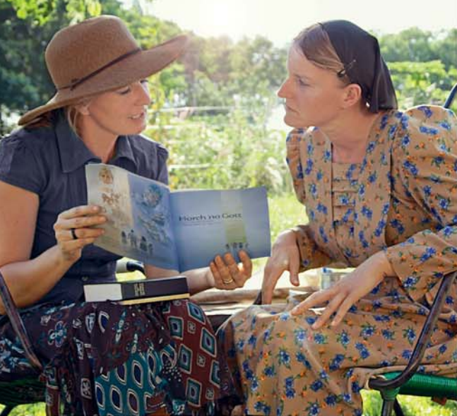
Bann piblikasyon dan langaz Low German i itil Paragway (Vwar portre lo paz 7)

nouvo kiltir pour zot kapab partisip dan sa travay Kreyen ki vreman enportan. Sa travay predikasyon ek lansennyman enternasyonal i en lot rezon ki konvenk bokou dimoun ki bann Temwen Zeova i bann vre disip Zezi Kri.