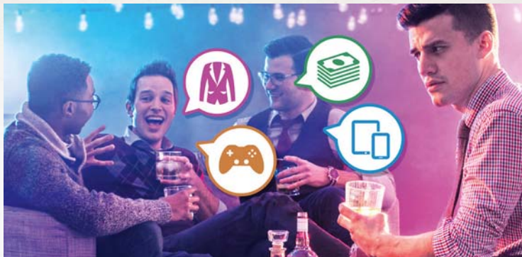
PŌZI 𐌲𐌹-𐌸𐌹 SE, ‘ɖɔɖ weyi man-taabalaa wɛni ma ne Yehowa ɖa-taabalye yɔɔɔ?’