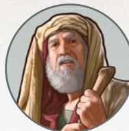
Eparama Tamadra e dua na iLala

Me vaka ga na ibalebale ni yacadrau, e qai tamadra dina na veimatani o Eparama, era basika tale ga na tui ena kawa i Sera.