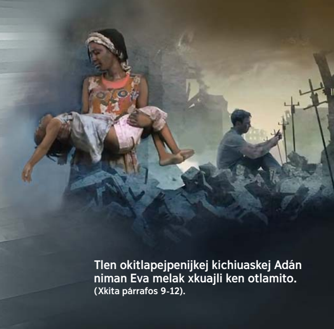
Tlen okitlapejpenijkej kichiuaskej Adán niman Eva melak xkuajli ken otlamito. (Xkita párrafos 9-12).

kamej yokimijkuilolkej, niman noiiki kenon melak miyekej abogados niman teyolkuitijkej nonekij niman ijkon makiteasikamachiltikan niman makintekitiltikan.