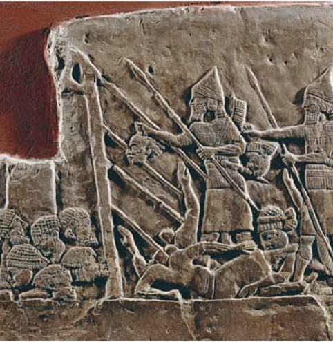
GORO MANYISO JOLWENY MOTING'O WIYE WASIKGI KENDO BIWOGI KAMORO ACHIEL