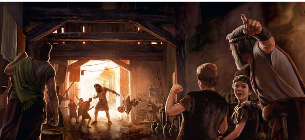
Noa gi chiege ne nigiting' mar rito nyithindgi mondo jomaricho ma ne odak e alworano kik kethgi

Noa ne nigiti tich mapek ma ne pok odwarone. Yieni ne dhi bedo marang'ongo—borne ne dhi bedo mita 133, lachne ne dhi bedo mita 22, kendo ne odhi bedo mita 13 kadhi malo. Ne