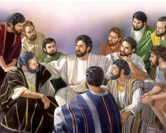
Yesuusammaniyoogaa bessiyooqaa giyoogee woygiyoogee?

Issitoo issi bitanee Yesuusa hagaadan giis: “Taanii ammanais; shin gujja ammananaadan, tana maaddarkkii.” (Mar. 9:24) Assi guutta ammanoy de’ees, shin I gujo ammanoy koshshiyooqaa eriya ashkke asa. Nu ubbawukka, ha bitaniyaadan gujo ammanoy issi wode koshshees. Qassi nu ubbaykka ha”i nu ammanuwaa minttana danddayoos. Xoossaa Qaalaa xanna’iyoonne wotti dentti qoppiyo wode, nu ammanoy minniyoogaa akeekida, hegee nuuni Yihoowa keehi nashshanaadan oottees. Nuuni nu mala Kiristaanetuura Yihoowawu goynniyo wode, nu hidootaabaa haratussi yootiyo wodenne woosan genciiyo wodekka nu ammanoy minnees. Hegaa bollikka, nu ammanoy mino gidikko, ubbaappe aadhdhiya woytuwaa nuuni ekkana. Xoossaa Qaalay nuna hagaadan zorees: “Ta dabbotoo, ubbaappe aadhdhiya geeshsha ammanuwan intte huuphiyaa keexxite; . . . intte huuphiyaa Xoossaa siiquwan wottite.”—Yih. 20, 21.