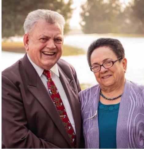
Arter Iskorddi (haddirssa bagga gaxan) ceeggikkokka, Yihoowawu oottanawu bawu danddayettida ubbabaa oottanawu koyiis. Anatol Melnikinne A machchiyaa Liidiyaa daro metoy de'ishinkka ammanettidi genccidosona (Mentto 11, 13 xeella)

hassayiyoogaanne nashshiyooгаа ammanetta- na danddayaasa. (Ibr. 6:10) Hegaa bollikka, nuuni Yihoowa wozanappe siiqiyoogaa bessi- yaabay ayyo daro oottiyoogaa gidennaagaa has- saya. Nuuni lo'obaa qoppiyo wodenne nuussi danddayettida ubbabaa oottiyo wode, Yiho- wa wozanappe siiqiyoogaa bessoos. (Qol. 3:23) Nuussi danddayettennabaa Yihooway akeekes, qassi nuuyyo danddayettiyaagaappe aaruwaa oottanaadan koyenna.—Mar. 12:43, 44.