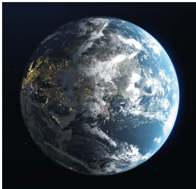
Qammayne gallassay ubbatoo de'anaagaa nuuni ammanettiyoogaadan, Xoossaa Qaalay ubbatoo polettanaagaa ammanettoos

Mazamure 27n qonccida qofayenne meezee neeyo de'ikko, neeyyookka Daawiteegaa mala ammanoy de'ana danddayees. Ammanuwawu denddoy suure eraa gidiyo gishshawu, Xoossaa Qaalaanne Geeshsha Maxaafaa qofay de'iyoy xuufeta neeni loy-