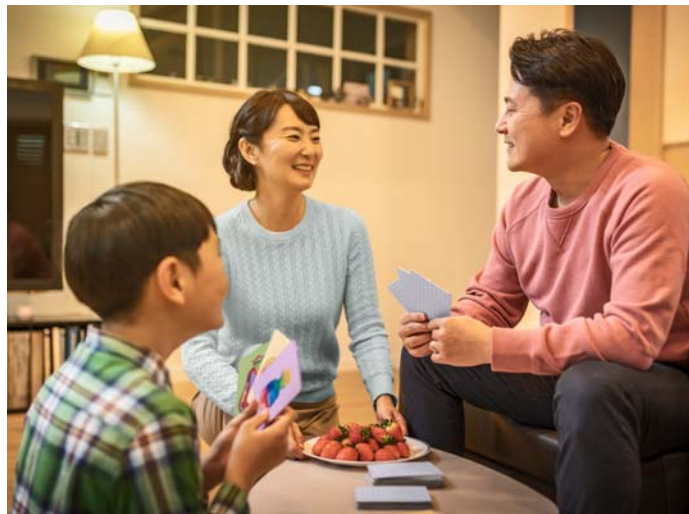
Neeni asawu qoppiyoogeenne ne oottiyoobay gita markka gidees (Mentto 6-8 xeella)

sabbakiyoogaaninne eta soo biyoogan omarsinne saaminttaa wurssettan daro wodiya aattiyoogaa guutaa takkada akeekaasu. Poolina, “Weyni issi issitoo soo simmiyo wode asi son baynna gishshawu moozottees” yaagaasu. Weyni ba machchiyaanne ba na’ay he wode banaara de’iyaakko dosees. I eta laggeta erenna, qassi Poolini ooratta laggeti iyyo appe aadhdiyaaba assi malatiis. Weyni Poolino paraman shaahettana giidi yashissiiis. Poolina ba azinawu qoppiyoogaa bessana ginata qoppaana danddayay?