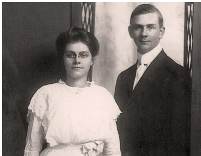
Royal Ispasinne A machchiyaa Peerla 1914n naagidobay polettin be'ibookkona, shin eti daro layttawu ammanettidi Yihoowawu haggaazidosona (Mentto 10 xeella)

12 Neeni Yihoowawu daro layttawu haggaa-zennan aggakka, qassi neeni ha'i sakettiyoogee kaseegaadan oottennaadan diggana danddayees. Yaatikko, azzanoppa. Neeni kase ammanettada haggaazidoogaa Yihooway