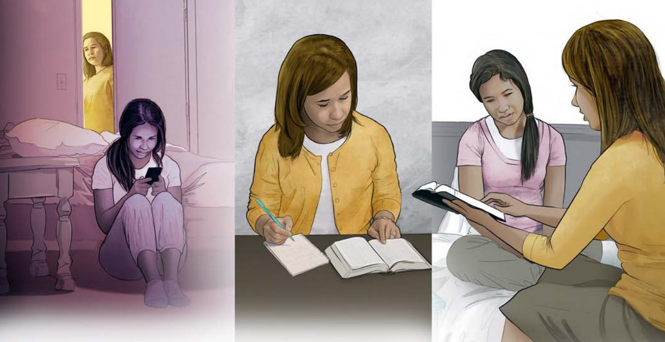
As ouers die Bybel op liefdevolle wyse gebruik “om dinge reg te stel” met hulle kinders, help hulle hulle om baie hartseer te vermy (Sien paragraaf 15)

oorsaak skerp kritiek dikwels baie pyn en bring dit selde enige voordele mee.—Spr. 12:18.