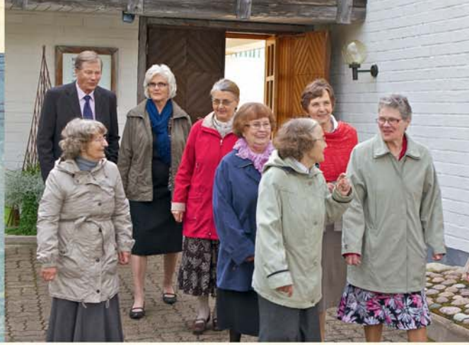
Party van dié met wie ons gestudeer het

vroeg in die lente was die sneeu so 'n pappery dat ons met moeite daardeur geloop het.