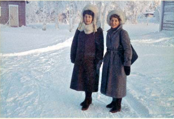
Saam in die bediening op 'n koue wintersdag