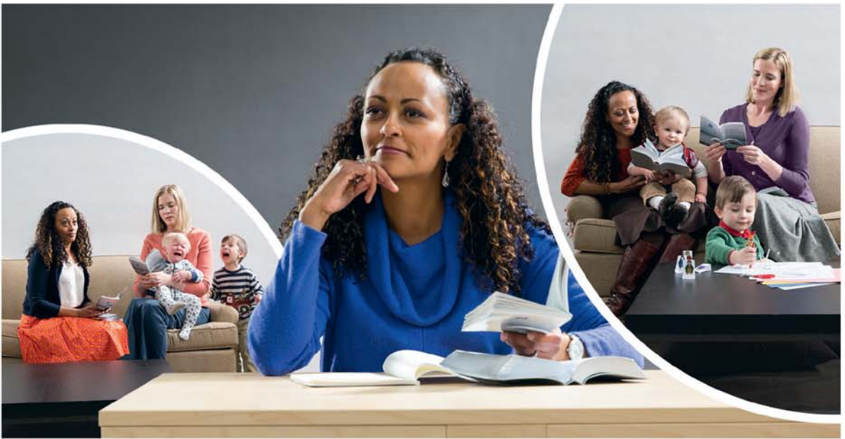
နကဘဉ် မၤစၢၤ နပူၤမၤလိလံာ်စီဆွဲတဖဉ် လၢကျဲၤဒ်လဲၣ်န့ၣ် မ့ၢ်နဆိကမိၣ်ထံဘဉ်မိ. (ကွၢ်လံာ်အဆၢ ၉)

၉ တၢ်မၤစီ စီပိလုး တဲဘဉ်စီတံၤမသုးလၢ အဝဲကဘဉ် ဆိကမိၣ်ထံက့ၤ အတၢ်စံးတၢ်ကတီၤ, အသကဲၣ်ပဝး ဒီးအတၢ် သိၣ်က့ၤသိက့ၤတဖဉ် ဒ်သီးကကဲဘျးကဲဖျိၣ်လၢ ပုၤဂၤအဂီၢ် န့ၣ်လီၤ. (ဖး ၁ တံၤမသုး ၄:၁၂-၁၆ တက့ၢ်.) နဲစ့ၢ်ကီး နဆိကမိၣ်ထံ တၢ်ဂ့ၢ်ဒ်န့ၣ်တဖဉ် သုဝဲလီၤ. အဒိ ဖဲနကတဲာ်က တီၤတၢ်လၢ နကလဲၤမၤလိ လံာ်စီဆွဲဒီးပုၤဂၤအခါ နကဘဉ် ဟံးန့ၢ်တၢ်ဆၢကတီၢ်လၢ နကဆိကမိၣ်ထံတၢ်အဂီၢ်န့ၣ်လီၤ. ဆိကမိၣ်ထံတၢ်သံကွၢ်ဒီး တၢ်အဒိတဖဉ်လၢ ကမၤစၢၤ ပုၤ မၤလိလံာ်စီဆွဲဖိ ဒ်သီးအဝဲသုၣ် ကဒိၣ်ထီၣ်ထီၣ်အဂီၢ်န့ၣ်တ က့ၢ်. နမ့ၢ်ကတဲာ်ကတီၢ်လၢ ကျဲၤအံၤ တချုးလၢ နလဲၤသိၣ် လိ လံာ်စီဆွဲအခါန့ၣ် နတၢ်န့ၣ်ကဒိၣ်ထီၣ်ဝဲလီၤ. တကးဒီးဘဉ် နကကဲထီၣ်ပုၤလၢ အသိၣ်လိလံာ်စီဆွဲသုၣ်ဂ့ၢ်တဂၤ ဒီးနတၢ် သျှဉ်ဆူၣ်သးဆူၣ်ကအါထီၣ်ဝဲလီၤ. တချုးလၢ နလဲၤစံာ်တဲၤ တဲၤလီၤတၢ်အခါ နမ့ၢ်အိၣ်ဒီး တၢ်ဆိကမိၣ်ထံန့ၣ် အဘျးက အိၣ်လၢနဂီၢ်စ့ၢ်ကီးလီၤ. (ဖး ၉:၅၁ ၇:၁၀ တက့ၢ်.) နမ့ၢ်