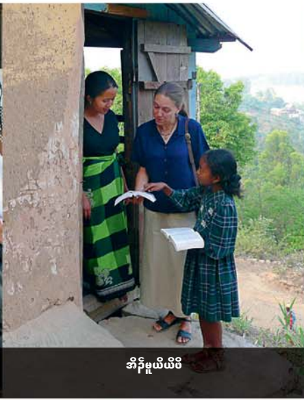
အိၣ်မူယိဖိ