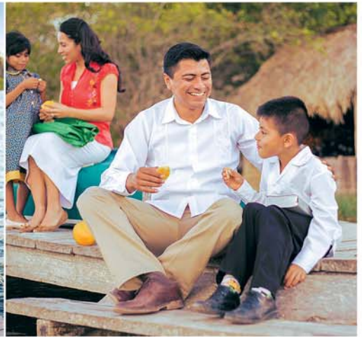
ပုလုအဂ္ဂိကျေးစားမ၊ တစ်စုံတဲလဲတဲလီတော်မ၊ တသွဲအသွတဖ်န့ၣ် ပာ်ဖျါထီၣ် အတၢ်န့ၣ်လၢ အဂၢၢ်ကျၢၤ (ဣၣ်လံာ်အဆၢ ၁၃)

န့ၣ်လီၤ. တၢ်အံၤကမၤစၢၤန့ၣ် ဒ်သိးနတၢ်န့ၣ်ကဂၢၢ်ကျၢၤဝဲန့ၣ် လီၤ. တကးဒီးဘၣ် နသုလံာ်စီဆံသ့စၢ်ကီးလၢ နကမၤကွၢ်နတၢ် န့ၣ်န့ၣ်မ့ၢ်အဂၢၢ်ကျၢၤၤ၊ တဂၢၢ်ကျၢၤၤန့ၣ်လီၤ.