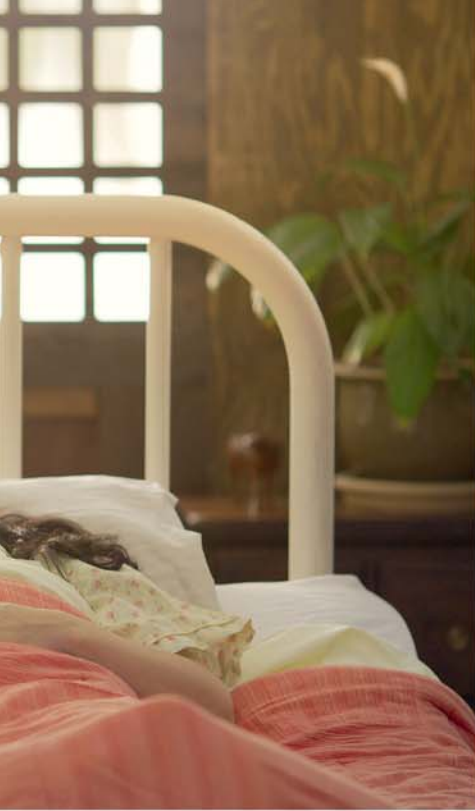
တၢ်ထုကဖဉ်န့ၣ် ဟ့ၣ်ပှၤတၢ်ဂံၢ်တၢ်ဘါ ဖဲပကွၢ်ဆၢၣ်မိၢ်ဘၣ် တၢ်မၤကွၢ်တဖဉ်အခါ

“ဖဲယဘၣ်ကွၢ်ဆၢၣ်မိၢ်ဘၣ် တၢ်ကိတၢ်ခဲဒိၣ်ဒိၣ်မုၢ်မုၢ်အခါန့ၣ် ယဃုဘါထုကဖဉ်တၢ် ဒီးယတူၢ်ဘၣ်လၢ ယတၢ်ဝံတၢ်ယံးသ့ၣ်တဖဉ်အံၤ ဖူလီၤဝဲ ဒီးယအိၣ်ဒီးဂံၢ်ဘါလၢ ယတူၢ်တၢ်ခိၣ်တၢ်ကကဲအဂီၢ်န့ၣ်လီၤ.” စံၣ်စံလယၣ်အိၣ်လၢ ကိၣ်ဖဲလဲးဖဲ (စံ)န့ၣ် စံးဝဲလၢ “ဒ်ယမုၢ်မိၢ်တဂၤအသိး ယဘၣ်ယိၣ်တၢ်လၢ ယဖိမုၢ်တဖဉ်အဂီၢ်ဒိၣ်မးလီၤ. ဒီးယဘၣ်ယိၣ်တၢ် စ့ၢ်ကိးလၢ ယမိၢ်အဂီၢ် မုၢ်လၢအကွၢ်န့ၣ်ယၤ တဘၣ်လၢတဘၣ်အသိးန့ၣ်လီၤ. ဘၣ်ဆၣ် ခိဖျိလၢ တၢ်ထုကဖဉ်အသိး ယတူၢ်ဘၣ်လၢ တၢ်ဖဲးတၢ်မၤလၢ ယဘၣ်မၤအီၤ ကိးနဲဒီးတဖဉ်န့ၣ် ဖူလီၤဝဲတဖဲးလီၤ. ယသ့ၣ်ညါလၢ ယဟံၣ်ယွၤကမၤစၢၤယၤ ဒ်သိးယကွၢ်ထွဲအဝဲသ့ၣ် ကသုအဂီၢ်န့ၣ်လီၤ.”