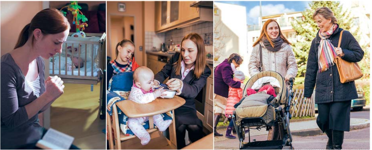
ပပ်ဖျါထီၣ် ပတၢ်န့ၣ်ဖဲပလဲၤဒီဖျါ တၢ်ကီၢ်တၢ်ခဲတဖၣ်လၢပတၢ်အိၣ်မူပူၤ (ကွၢ်လၢ်အဆၢ ၁၄)

အတၢ်မၤစၢၤအခါ ပတၢ်န့ၣ်ဒိၣ်ထီၣ်အါထီၣ်ဝဲလီၤ. —စံးထီၣ်ပတြၢၤ ၃၄:၈.