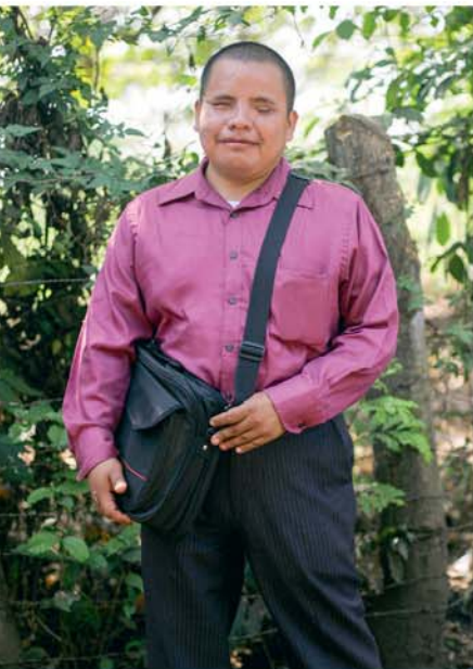
ကျူၣ်လဲအိၣ် ခိၣ်ရဲယိၤ တဲၤဖျါထီၣ်အတၢ်လဲၤဒီဖျါ