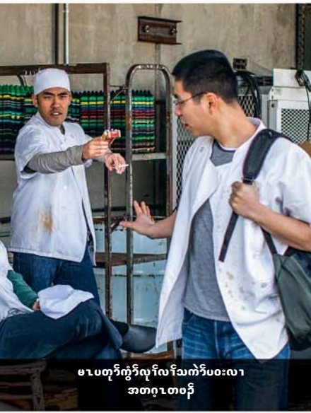
မာပတုၤကွၢ်လုၢ်လၢ်သကံၢ်ပဝးလၢ အတဂ့ၤတဖၣ်