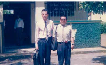
ယၤဒီး ဒီပုၤဝဲၣ်တၢ်လၢ အဟံၣ်ဖိယိၤမိၤစၢၤယၤ