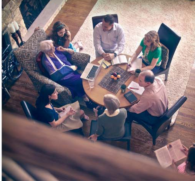
E mafai ona talanoa faatasi le aiga i le auala e fo’ia ai faafitauli (Taga’i i le palakalafa 6-8)

9, 10. O ā nisi vala e ono mana’omia ai e mātua le fesoasoani a fanau?