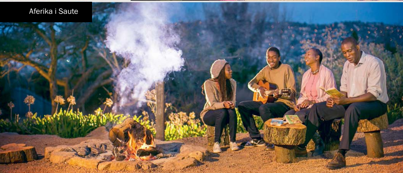
Aferika i Saute