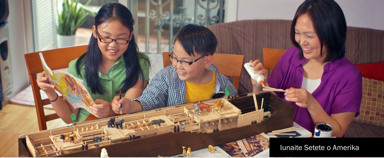
Lunaite Setete o Amerika