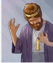
Ẹwẹn rẹ Abe