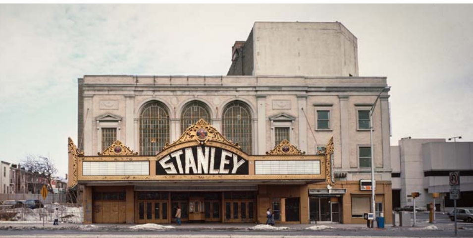
Te Stanley Theater tei okoia mai

Kua okoia te Stanley Theater i Jersey City, New Jersey ia Noema 1983. Kua pati te au taeake kia akaouia te au ngai no te uira e te ngai tae anga o te vai. Ia ratou e aravei ra i teia au konitara, kua akamārama te au taeake kia tukuia tetai patiangā kia taangaanga i te Stanley Theater ei ngai uruoaanga no te au Au Kite o lehova. Kua tupu tetai manamanata. Kua patoi te oire konitara kia kore e akatuia tetai ngai akamori anga i te ngai e noo ra te tangata. Tei roto te Stanley Theater i te oire o te au pitiniti, no reira kare te oire konitara i akatika mai i te pepa patiangā. Kua tuku te au taeake i tetai patiangā akavaanga, inara kua patoia mai te reira.