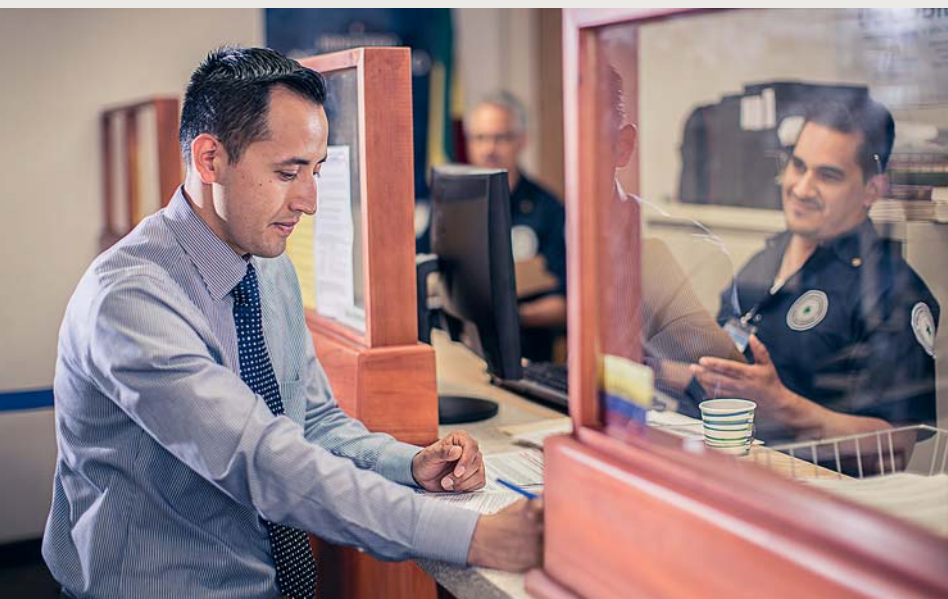
Meda vakayagataka na lotu vaKarisito na lewaeloma vakavulici vakaivolatabu nida veitaratara kei ira na vakaillesilesi vakamatanitu

Ia eso na vakaillesilesi vakamatanitu ena so na vanua, e sega kina na lawa va qori se sega ni vakaukauataki sara na kena muri. Era raica ni sega ni cala na kena soli na iloloma se ilavo. Ena so tale na vanua, era vakayagataka vakatani na vakaillesilesi na nodra itutu mera taura kina vakailoa na ilavo se so tale na veivuke vei ira e dodonu mera qarava, era na sega tale ga ni via qaravi ira ke sega ni soli na iloloma. Era dau lavaka gona na ilavo o ira na vakaillesilesi era dau vakalawataka na vakamau kei na kumuni ni ivakacavacava, ira na dau vakadonuya na tara ni vale kei na so tale. Ke bera-bera na soli ni ilavo, era nakita na vakaillesilesi mera vakadredretaka na nodra qaravi na lewenivanua ena ka e donu vakalawa me nodra, so na gauna era sega sara ga ni via qaravi ira. E vola-