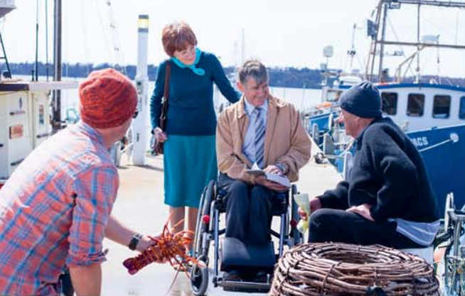
Eda vunau e veivanua kece ga (Raica na parakaravu 10)

lewe ni nodra lotu ni nodra itavi ga na italatala mera vunau, nira saumi kina. Ia era sega ni “gonedau ni tamata” na nodra italatala, era kauaitaka ga vakalevu mera karoni ira na lewe ni ivakoso sa tu rawa. Ena so na gauna, era dau muria eso na nodra italatala eso na iwalewale ni veivakalotutaki. Kena ivakaraitaki, ena itekitekivu ni yabaki 2001 e vola kina na tui tabu o John Paul II: “Ena veiyabaki sa sivi au dau taleva na ivunau me baleta na iwalewale vou ni veivakalotutaki . Au tokaruataka tale qo . . . Meda yalogu tale me vakataki Paula, ni kaya: ‘Au na kalouca keu sega ni vunautaka na Kosipeli.’” E kaya tale na tui tabu ni itavi qo “e sega ni rawa ni vakatautaki ga vei ira na ‘kenadau,’ e dodonu me nodra itavi kece na Tamata ni Kalou.” Ia e le vica era sa muria na ka e tukuni qori?