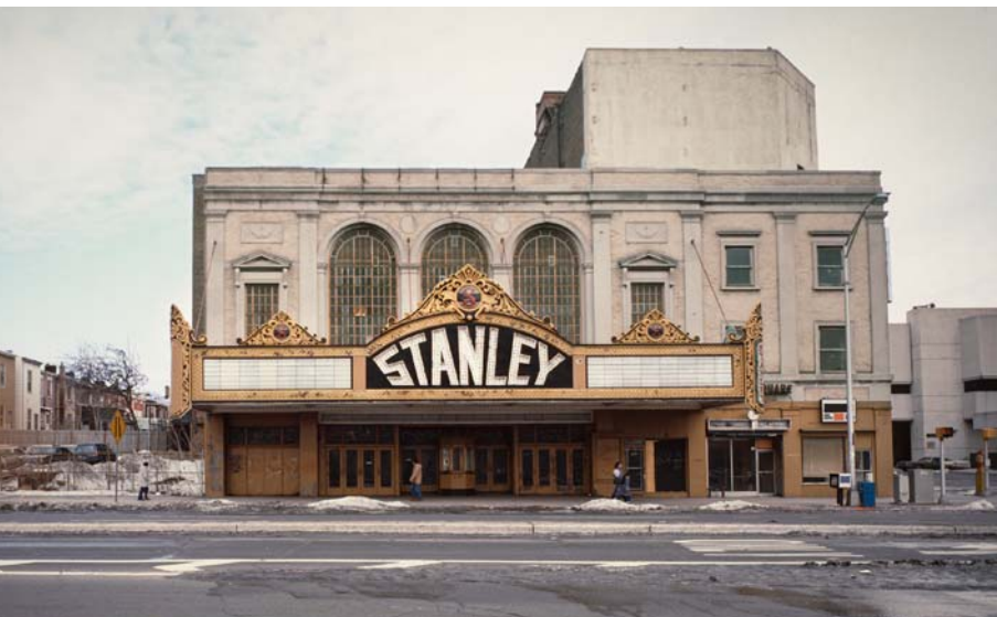
Das Stanley Theater, als es gekauft wurde

In meiner ersten Woche im Bethel reichte die Organisation Klage gegen die Verweigerung der Genehmigungen ein. Da ich gerade mein zweijähriges Referendariat am Bundesbezirksgericht in St. Paul beendet hatte, war ich mit derartigen Fällen vertraut. Einer unserer Anwälte argumentierte, das Stanley Theater sei bereits für verschiedene öffentliche Veranstaltungen genutzt worden, von Filmvorführungen bis Rockkonzerten. Warum sollte eine religiöse Veranstaltung dann unzulässig sein? Das Bundesbezirksgericht befasste sich mit dem Fall und urteilte, Jersey City habe unser Recht auf Religionsfreiheit verletzt. Die Stadt musste die nötigen Genehmigungen erteilen, und ich erlebte zum ersten Mal, wie Jehova es segnete, dass seine Organisation zur Förderung des Werks Rechtswege beschritt. Ich freute mich sehr, dass ich daran einen Anteil haben durfte.