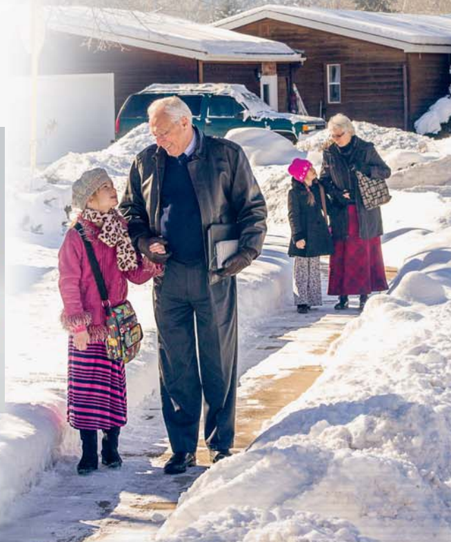
Avwanre he iruo aghwohwo na ve ivwromọ avwanre