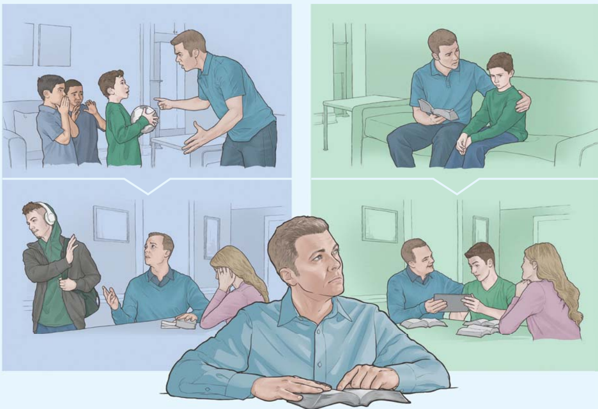
Idjerhe wọ vwọ ghwọku ọmọ wẹn nonẹna che djobọte otaẹtakuẹgbẹ wẹn vẹ ọ rọyen vwẹ obaro

Ọghẹnẹ].” Ra vwọ djoshọ rẹ odẹ rẹ Jihova mudiaphiyọ re vwo muọghọ kẹ Ọghẹnẹ. E vwo muọghọ okokodo kẹ oborẹ odẹ rọyen na mudiaphiyọ kugbe irhi rọyen. Wo ki se muọghọ kẹ ohwo, ku wọ riẹn obo ro roro emu wan. Ọtiọyena, ku wọ sa vverosuọ, yono mie, je mrẹ oka rẹ erere ro rhiẹromrẹ. A sa tanẹ avwanre vwo omamo rẹ aghwanre siẹrẹ e de roro kpahen oborẹ uruemu avwanre che djobọte oyerinkugbe avwanre vẹ Jihova wan, kugbe avwanre de ji brorhiẹn nene iji rọyen.