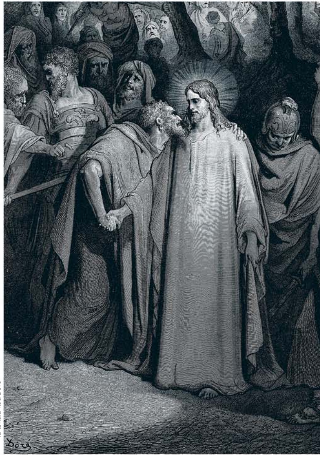
ia tokala kua Doré

O códice íii a i bhakele mivu iavulu bhu kididi kia kukuta ku Ijitu, maji kioso kia i katula-mu,