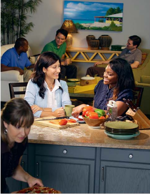
Akamanako atu i te au tokorua kare i te Kite

ratou i to kotou aerenga viivii kore i kapiti katoaia i te matakū.” (1 Pete. 3:1, 2) Ka rauka i tetai vaine i te tauturu i tana tane kia ariki mai i te akamorianga mou na te kauraro anga e te akangateitei anga iaia, noatu ka takinokinoia mai aia. E ka akono tau katoa te tane irinaki iaia uaorai na roto i te tu e inangaro ra te Atua e kia riro ei upoko aroa no te ngutuare, noatu te patoi maira tana vaine.—1 Pete. 3:7-9.