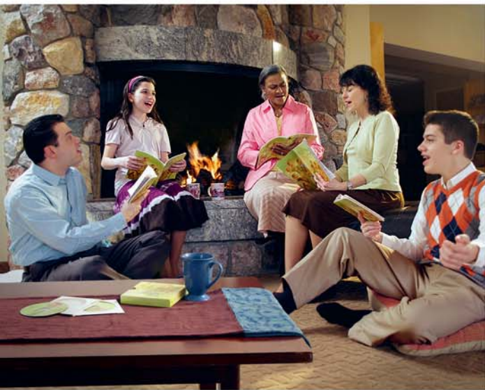
Akamaroiroi i te tu papu na te apiipii meitaki anga i ta tatou au imene

takinga-meitaki ratou, e kia apingaia ra i te angaanga meitaki ra, kia maata atu ia ia ratou kia oronga aere, kia tau i te uipa; I te akaputu marie anga i te meitaki tumu no ratou uorai a muri atu, kia rave ratou i te ora mutu kore.” (1 Timo. 6:17-19) Te akamaroiroi ra a Paulo i tona au taeake akamori kia akatupu i te tu oronga. Ka rauka ia tatou i te akaari i te tu oronga me kare e meitaki ana te turanga i te pae moni. Tetai mataara meitaki i te rave i teia, e apai i te au taeake ki te angaanga orometua e ki te au uipaanga, me ka anoanoia. Akapeea te aronga e puapingaia ai mei taua au tu takinga meitaki ra? Te akatupu ra ratou i te tu papu i roto i te putuputuanga me akaari ratou i te ngakau ariki rekareka, penei na te tauturu anga i te pae o te penitini. Pera katoa, me akapou tatou i tetai taima ki te au taeake e te au tuaine pae vaerua, kare ainei e ka mataora ratou e te inangaro nei tatou ia ratou?