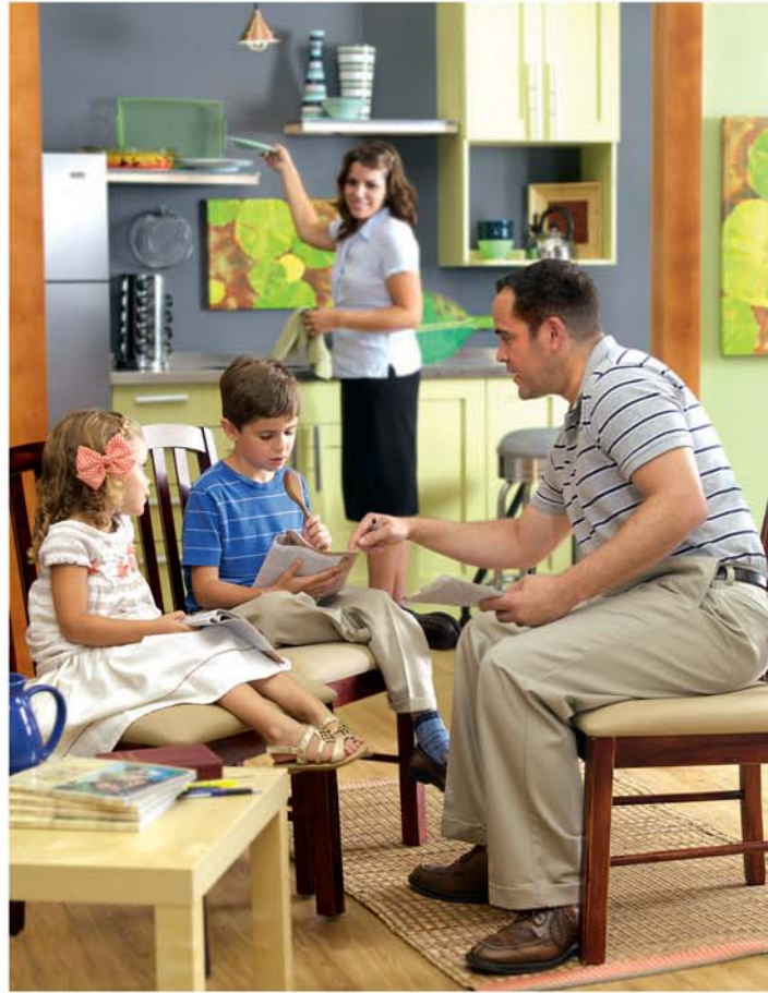
Te akamaroiroi ra ainei koe i te tu papu na te akapapaanga i te au pauanga meitaki?

5, 6. Akapeea tatou me akaari i te tu takinga meitaki e te tu oronga ki tetai ke, e eaa ta teia ka akatupu i roto i te putuputuanga?