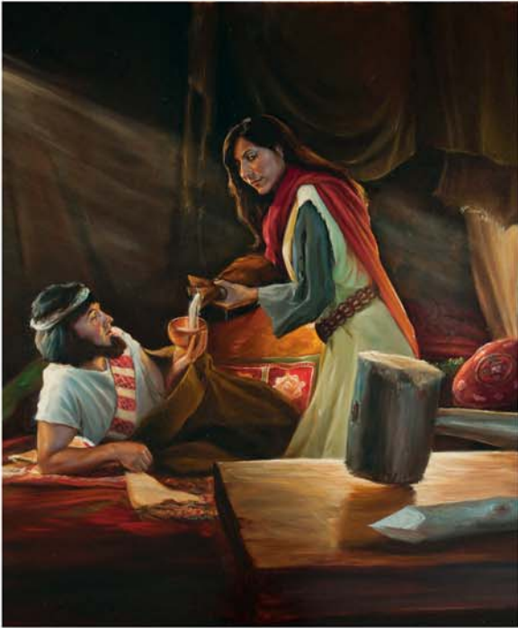
E tu maroiroi e te matutu to Iaela

vaine akaturi ko Rahaba o Ieriko i te Atua, na te uuna maroiroi anga i te nga tutaka ta Iosua i tono atu, e te arataki ke anga i te au tavini o te ariki o taua oire ra. Kua akaraia mai aia e tona pamiri te autu anga te ngati Iseraela ia Ieriko. Kua akaruke a Rahaba i tona oraanga tau kore, kua akamori akarongo mou ia Iehova, e kua riro mai ei tupuna vaine no te Mesia. (Iosu. 2:1-6; 6: 22, 23; Mata. 1:1, 5) Kua akameitakiia aia no tona akarongo e te maroiroi!