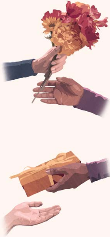
ఇవ్వడం వల్ల సహకారం, స్నేహం పెరుగుతాయి

దీన్ని విపరించే ఒక అనుభవాన్ని చూడండి, ఇది అమెరికాలో ఫ్లోరిడా అనే ప్రాంతంలో జరిగింది. పెద్ద తుపాను వచ్చిన తర్వాత, కొంతమంది యెహోవా సాక్షులు సహాయక చర్యలు చేయడానికి వచ్చారు. వాళ్లు బాగు చేయాల్సిన ఇంటి దగ్గర సామాన్ల కోసం ఎదురు చూస్తుండగా పక్కనే ఉన్న ఒక ఇంటి పెన్స్ పాడై నట్టు గమనించి దాన్ని బాగు చేస్తామని అడిగారు. ఆ ఇంటి వ్యక్తి కొంత కాలం తర్వాత యెహోవాసాక్షుల ప్రధాన కార్యాలయానికి ఇలా లెటర్ రాశాడు: “నేను ఎప్పటికీ కృతజ్ఞుణ్ణి. నేను ఇప్పటి వరకు కలిసిన వాళ్లలో ఇంత మంచి వాళ్లను ఎప్పుడూ చూడలేదు.” యెహోవా సాక్షులు గొప్ప పని చేస్తున్నారని చెప్పి కృతజ్ఞతగా ఆ పనికి ఉపయోగపడేలా ఉదారంగా విరాళం ఇచ్చాడు.