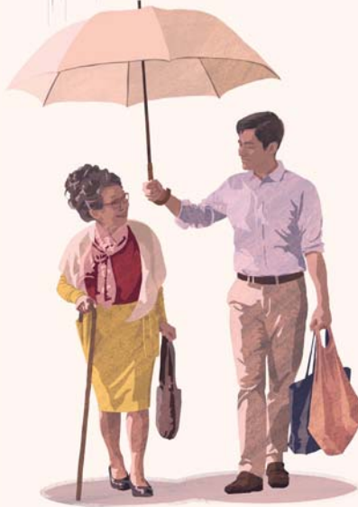
ఇవ్వడం మీకు, ఇతరులకు మంచి చేస్తుంది

ఇతరులకు సహాయం చేస్తూ ఉండే వాళ్లకు బాధలు, నొప్పులు, డిప్రెషన్ తక్కువగా ఉంటాయని అధ్యయనాలు చూపిస్తున్నాయి. మొత్తం మీద వాళ్లకు మంచి ఆరోగ్యం ఉంటుంది. ఉదారంగా ఇచ్చే కొంతమందికి దీర్ఘకాలిక ఆరోగ్య సమస్యలు అంటే మల్టిపుల్ స్క్లెరోసిస్, హెచ్ఐవి లాంటివి ఉన్నా వాళ్ల ఆరోగ్యం మెరుగౌతుంది. తాగుడు మానుకోవాలని అనుకునేవాళ్లు ఇతరులకు సహాయం చేస్తే ఎక్కువగా కృంగిపోకుండా, మళ్లీ తాగు