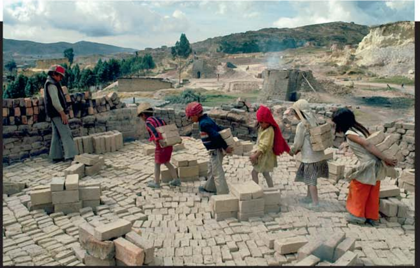
లక్షలమంది ఇంకా బానిసలుగా వెట్టిచాకిరి చేస్తున్నారు

రోమా సామ్రాజ్యంలో కూడా యుద్ధాల వల్ల పుష్కలంగా బానిసలు దొరికేవాళ్లు. కొన్నిసార్లు బానిసల్ని సంపాదించుకోవడం కోసమే యుద్ధాలు చేసేవాళ్లు. మొదటి శతాబ్దం వచ్చే సరికి రోములో దాదాపు సగం జనాభా బానిసలే ఉండి ఉంటారని అంచనా. చాలామంది ఐగుప్తీయులు, రోమీయులు బానిసల్ని ఘోరంగా హింసించి చాకిరి చేయించేవాళ్లు. రోమా గనుల్లో పని చేసే బానిసల జీవితకాలం చాలా తక్కువ. 30 సంవత్సరాలకన్నా ఎక్కువ బ్రతికేవాళ్లు కాదు.