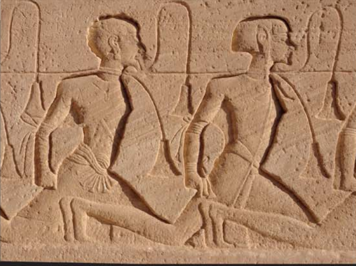
పూర్వం ఐగుప్తులో బందించిన బానిసలను చూపిస్తున్న చిత్రం