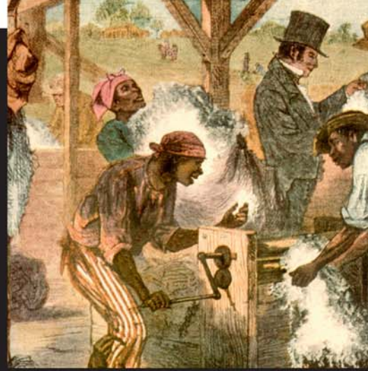
ఆఫ్రికా అమెరికాల మద్య జరిగిన బానిసల వ్యాపారం చాలా లాభాలు తెచ్చేది