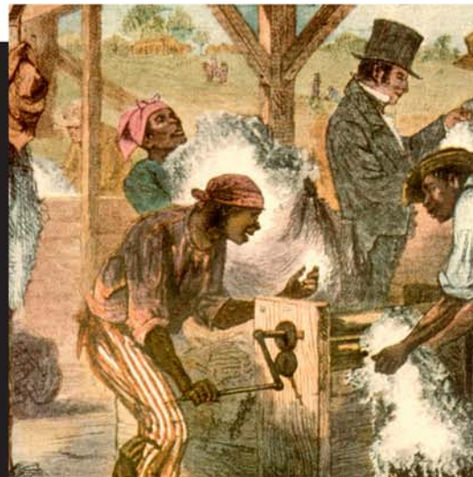
E imiraa moni hoona mau te hooraa i te tītī i te mau fenua Afirika e Marite no apatoerau e apatoa