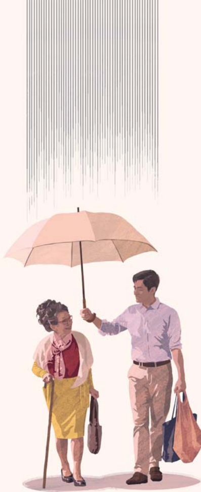
Ma te horoa noa, o oe e o vetahi ê atoa te oaoa

Ua ravehia te tahi maimiraa i rotopu i te feia o te horoa noa ia ratou no te tauturu ia vetahi ê. Ua itehia mea varavara a’e ratou i te ma’ihia, i te mauui i nia i te tino e te hepohepo. E ea maitai a’e to ratou. E haamaitai atoa te hoê aau horoa noa i te ea o te feia e ma’i tamau to ratou. Mai te ma’i o te haafifi i te mau uaua uira e te mootuaio, oia atoa tei