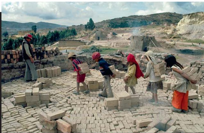
E mirioni o te faatītī-noa-hia ra

e te hamaniraa i te mau taheraa pape i roto i te mau faaapu.