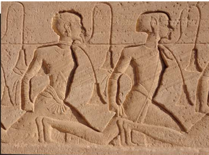
Te mau tītī i Aiphiti i tahito ra