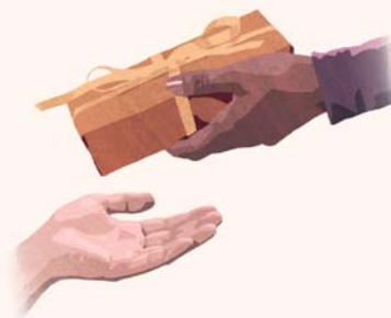
Ma te horoa noa, e hinaaro vetahi ê ia ohipa e oe e faahoa 'tu