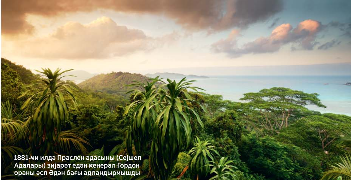
1881-чи илдэ Праслен адасыны (Сейшел Адалары) зижарэт едэн кенерал Гордон ораны эсл Эдэн бағы адландырмашды

бүтүн Јер үзү». Сонралар Милтон бу поеманын давамы олан «Гайтарылмыш чэннэт» поемасыны гэлэмэ алмышды.