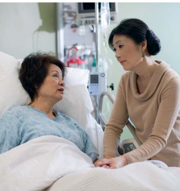
Һеч кәсин көмәк әлини кери гәјтармајын

Доғма адамын өлүмүнү фикирләшэндэ инсанын үрәји ган ағлајыр. Бу, тәбиидир, чүнки инсан өлмәк үчүн јаранмајыб , буна көрә дә биз өлүмлэ барыша билмирик (Ромалылара 5:12). Бу сәбәбдән Мүгәддәс Китабда өлүм «дүшмән» адланыр (1 Коринфлилэрэ 15:26). Буна көрә дә тәбиидир ки, доғма адамымызын өлүмү барәдә фикирләшмәк истәмирик.