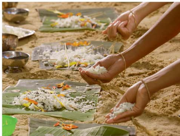
Демәк олар, бүтүн әсас динләрин нүмајәндәләри руһун өлмәзлијинә инаныр