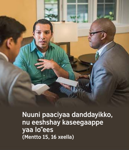
Nuuni paaciyaa danddayikko, nu eeshshay kaseegaappe yaa lo'ees (Mentto 15, 16 xeella)