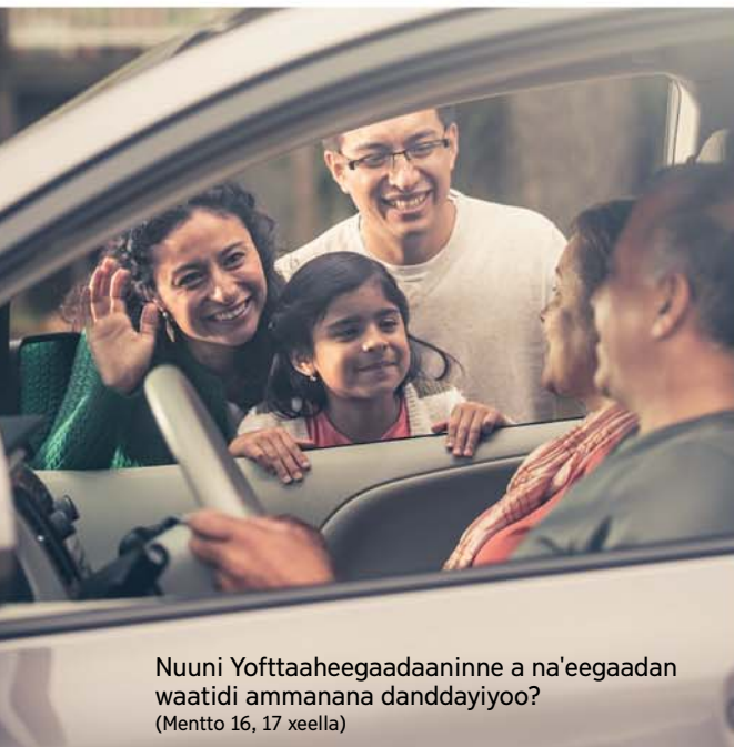
Nuuni Yofttaaheegaadaaninne a na'eegaadan waatidi ammanana danddayiyoo? (Mentto 16, 17 xeella)

16. Yofttaahe na'iyaa ba aaway qaalaa gelidobaa siyada woygadee? (Doomettan de'iya misiliyaa xeella.)