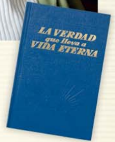
Digettidaba geetettida maxaafaa