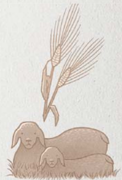
Miyo nyig yadi mukwongo cek kacel ki lutino kayo me lee macalo gityer bot Jehovah