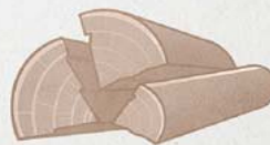
Kelo yen ma kitiyo kwede me wango gitum i keno tyer