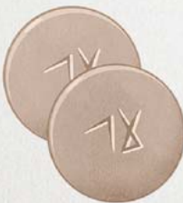
Bolo mot me cente