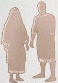
Nyomme i kin jo ma woro Jehovah keken

Cwako kor yub me woro me ada onongo kwako: