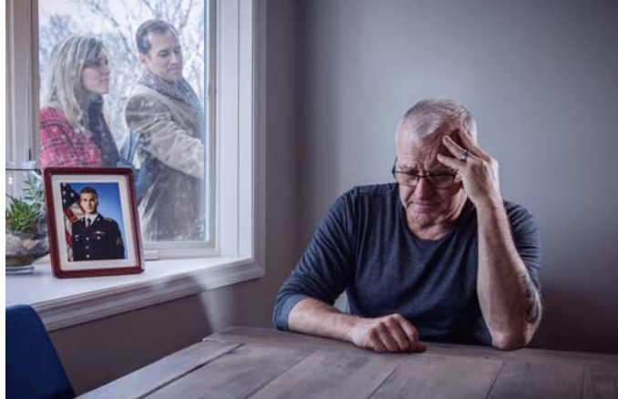
I mua i te fifi, e tauhi paha te huru o vetahi

No te ohipa ino paha ta ratou i ite, e mana’o faahapa to vetahi no nia i te Bibilia e te mau Kerisetiano. Ua faaroo paha te tahi atu i te parau hape no nia i ta tatou mau tiaturiraa. Te mātā’u ra paha vetahi ia faaooo atu te fetii aore ra te feia tapiri ia farii ratou i te hoē aparauraa.