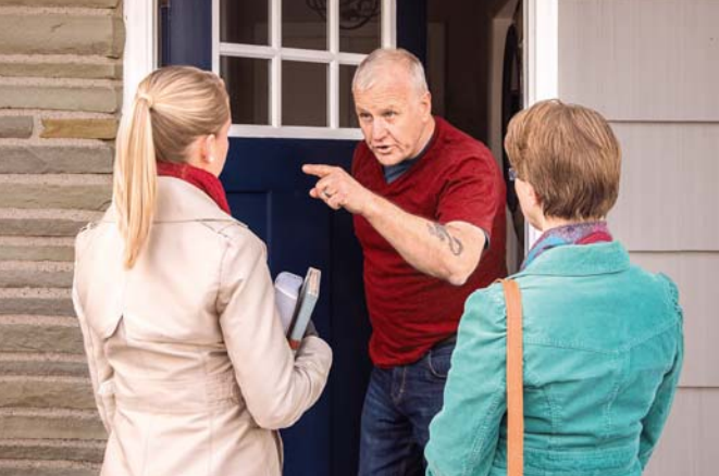
Eiaha e toaruaru ia ore te tahi e farii oioi i te poroi