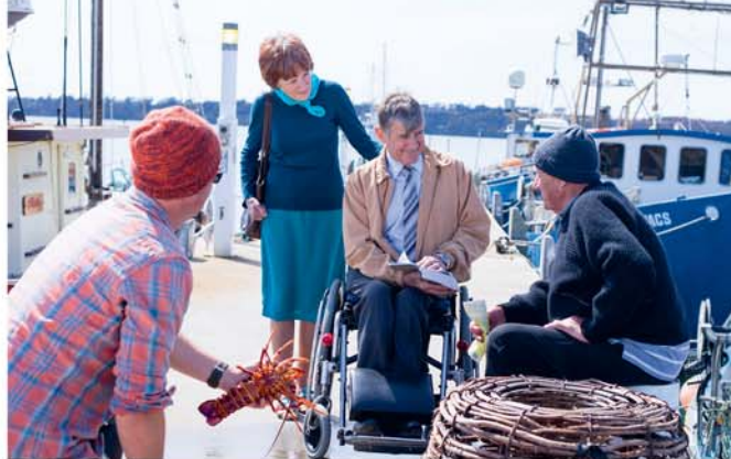
ما هر جا که مردم هستند، موعظه می‌کنیم (بند ۱۰ ملاحظه شود)

از اهمیت بسزایی برخوردار است. (مرق ۱۰:۱۳) در کتابی در مورد گروه‌های مختلف مسیحی آمده است: [۱] «برای شاهدان یهوه خدمت موعظه از هر کاری بیشتر اهمیت دارد.» نویسنده این کتاب به گفته یکی از شاهدان یهوه اشاره می‌کند و چنین ادامه می‌دهد: «اگر آنان شاهد گرسنگی، تنهایی و ضعف کسی باشند، یاری می‌کنند. . . اما هیچ‌گاه فراموش نمی‌کنند که وظیفه اصلی‌شان این است که پیام به پایان رسیدن دنیا و نیاز به نجات را به مردم برسانند.» شاهدان یهوه همچنان با استفاده از روشی که عیسی و شاگردانش به کار می‌گرفتند، این پیام را به مردم می‌رسانند.