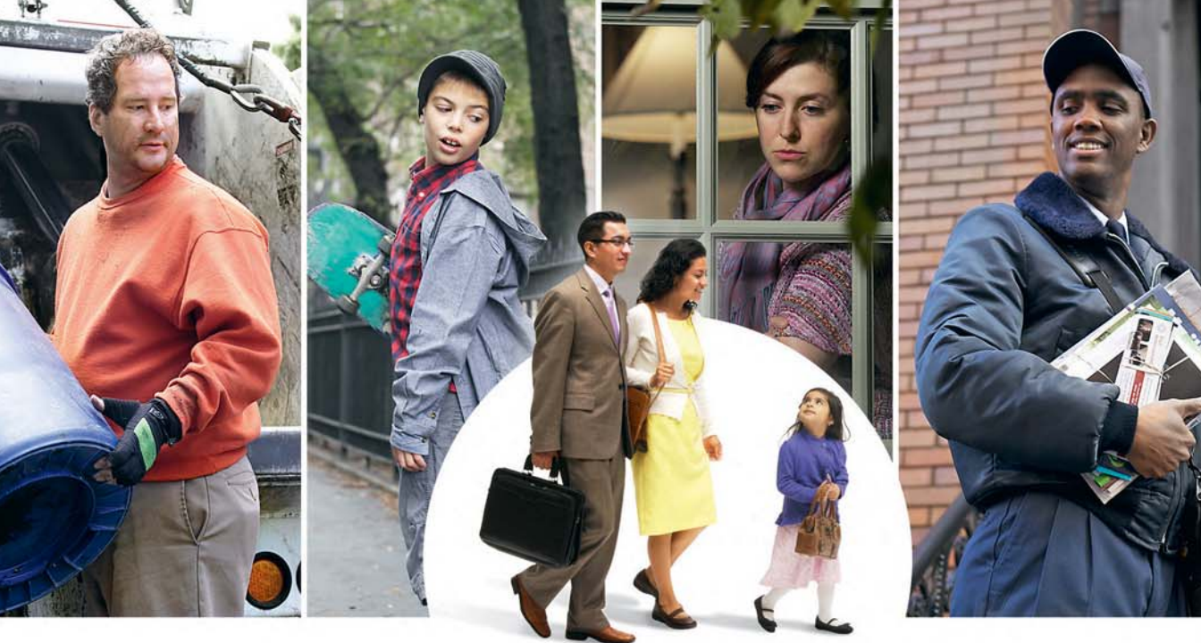
Ou prezans dan predikasyon i ase pour donn en bon temwannayaz

pour servi dan bann pei etranze. (Fili. 2:17, NW) Ki nou pou dir konsernan nou bann ansyen ki travay dir e ki pa manze ouswa mank sonmey pour pran swen avek troupou Zeova? I osi annan bann aze ek sa bann ki lasante pa tro bon ki fer zot mye pour asiste renyon e partisip dan predikasyon. Nou leker i ranpli avek lapresyasyon kan nou mazin tou bann serviter Zeova ki annan en leta lespri sakrifis. Bann zefor koumsa i annan lefe lo lafason ki lezot i vwar nou minister.