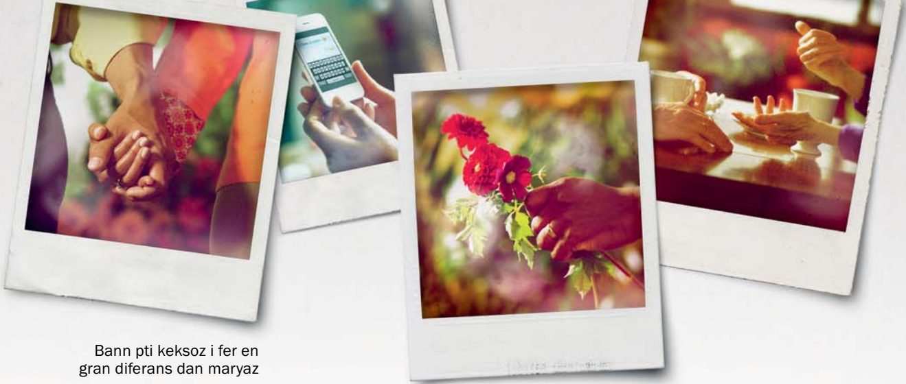
Bann pti keksoz i fer en gran diferans dan maryaz

keksoz anndan, par mazinen, ‘Si mon pa koz lo mon problemn, sa problemn pou disparet.’ Me, mon’n realize ki i pa en febles pour eksprim mon santiman. Kan mon fer zefor pour eksprim sa ki mon santi, mon priye pour servi sa bon parol e sa bon fason pour dir zot. Apre mon pran en gran respirasyon e konmans koze.” Sa ki osi ede, se pour swazir sa bon moman, petet ler zot tousel pe egzamin teks pour lazournen oubyen pe lir Labib.