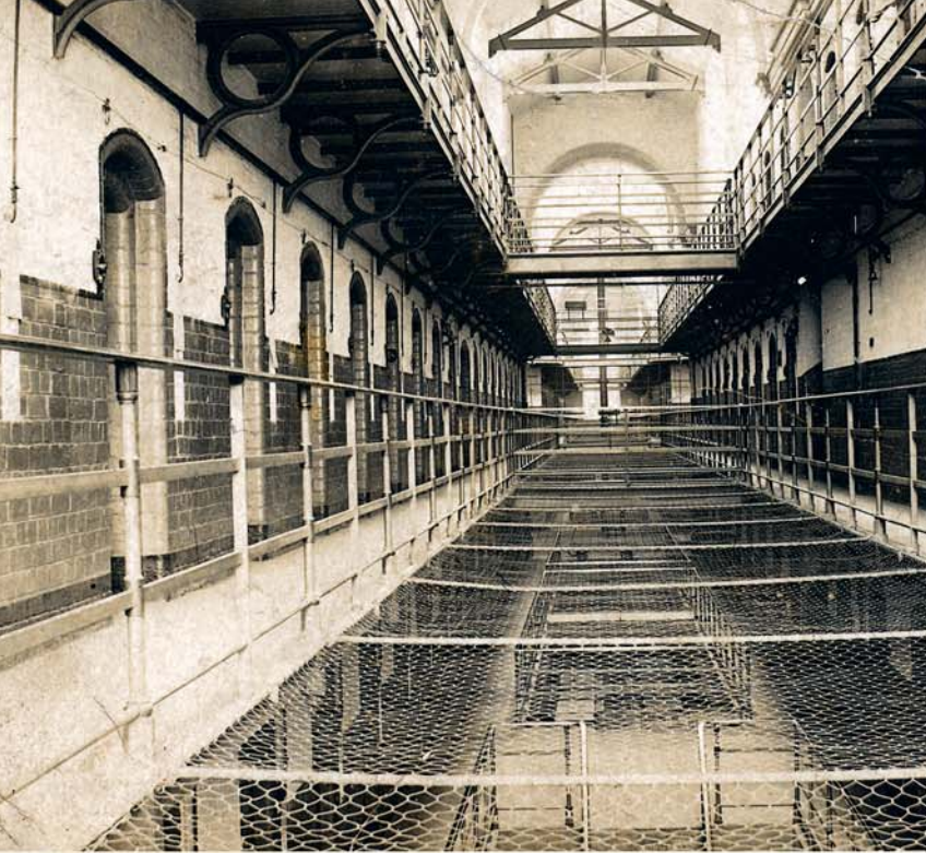
Prizon Dartmoor, kot bokou Etidyan Labib ti ganny anprizonnen