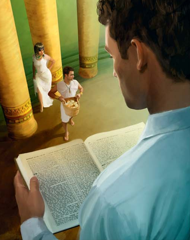
Nou ranforsi nou defans par rod lasazes Zeova

nou spirityalite. Sa bann provizyon i enplik letid Labib, renyon, predikasyon ek lapriyer. (1 Kor. 15:58) Sak fwa nou devid nou leker avek Zeova dan lapriyer e sak fwa ki nou partisip aktivman dan predikasyon, nou pe ranforsi nou defans kont tantasyon. ( Lir 1 Timote 6:12, 19. ) Ziska en serten degre, se nou zefor ki pou determinen ki degre for nou defans pou ete. (Gal. 6:7) Proverb sapit de i met lanfaz lo sa pwen.