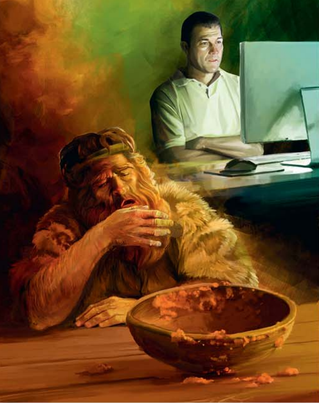
Pa met ou leritaz spirityel an danze

ti mepriz son drwa konman premye ne.” —Zen. 25:29-34.