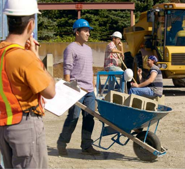
Lezot i remark ou lonnekte ek travay dir

zanmi ti debarke. Ler i ti vwar sa, sa drayver ti vire e demann li, “Ou en Temwen Zeova ou?” Sa ser ti dir, “Wi, me akoz ou demann sa?” Drayver ti dir: “Mon’n tann ou konvèrsasyon konsernan pey tiket e mon konnen ki Temwen Zeova i parmi sa ptigin dimoun ki fer sa e ki onnet dan tou keksoz.” Detrwa mwan pli tar, en zonn ti apros sa ser kot lasal e dir, “Ou rapel mwan? Mwan menm sa drayver bis ki ti koz avek ou konsernan pey tiket. Apre ki mon ti’n obzerv ou kondwit, mon ti deside konmans etidye Labib avek Temwen Zeova.” Nou repitasyon konman bann dimoun onnet i onor nou konman bann evanzelizater ki diny konfyans.