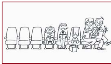
a tapao ai tatou i te mau parahiraa?