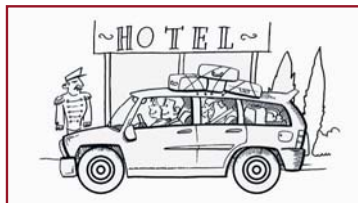
i te vahi e noho ai tatou no te tairururaa?