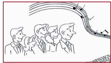
a fatata 'i te upaupa i te haamata?