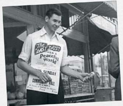
▲ Mono ti bampangi ya bifwa-makutu na lukutakanu ya distrike na mbanza Cleveland, na Ohio, na 1946