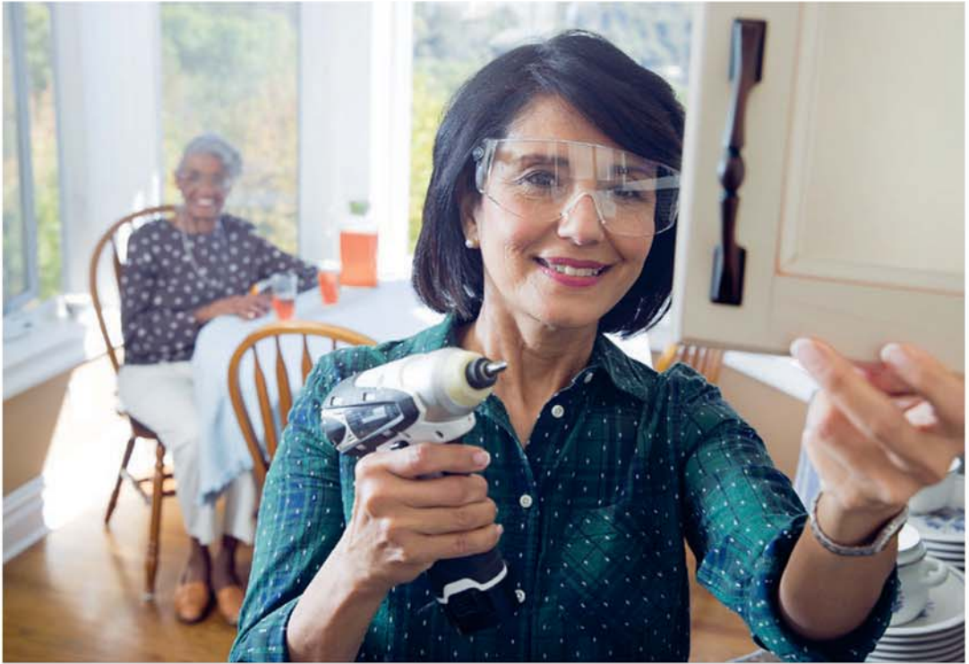
Zola bampangi (Tala paragafe 17)

zola bima mingi. (2 Tim. 3:1, 2) Bakristu fwete sala bikesa na kuzola mingi Yehowa, Ndinga na yandi mpi bampangi. Sambu beto kele bantu ya kukonda kukuka, bantangu ya nkaka mwa mavwanga lenda basika na kati na beto. Kansi sambu beto ke zolanaka, beto ta manisa yo nswalu mpi na mawete yonso. (Baef. 4: 32; Bakol. 3:14) Beto fwete bika ve ata fioti nde zola na beto kumana! Kansi beto fwete landa kuzola mingi Yehowa, Ndinga na yandi mpi bampangi na beto.