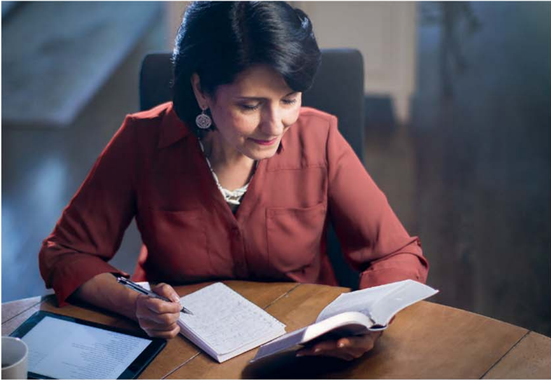
Zola Biblia (Tala paragafe 14)

Yehowa mpi kuzabisa nsangu na yandi. Kana beto ke zola Biblia, beto ta bakisa mfunu ya kuvanda Bamangi ya Yehowa mpi ya kulonga nsangu ya Kimfumu na bilumbu yai ya nsuka.