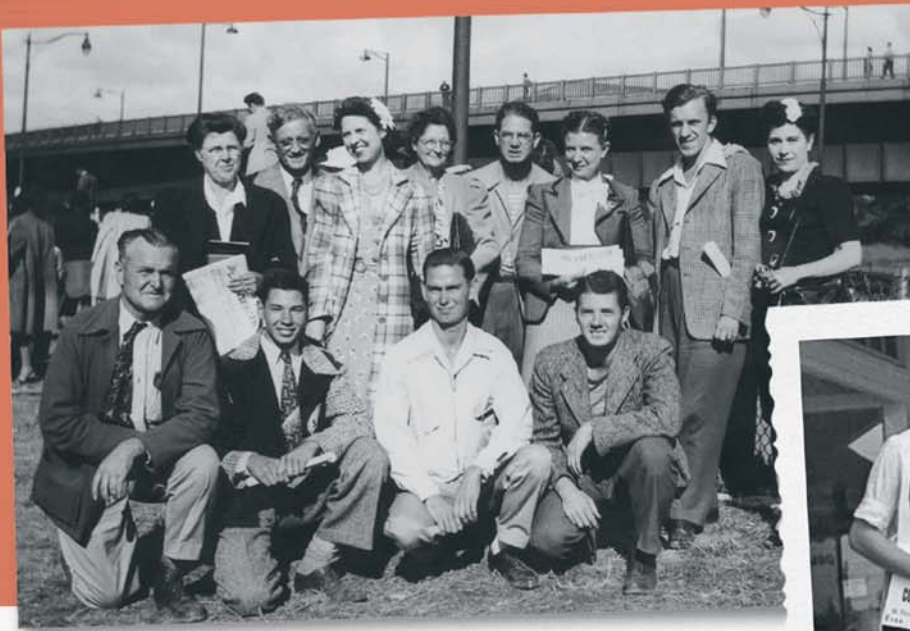
Beto ke samuna na bala-bala na luyantiku ya bamvu 1950