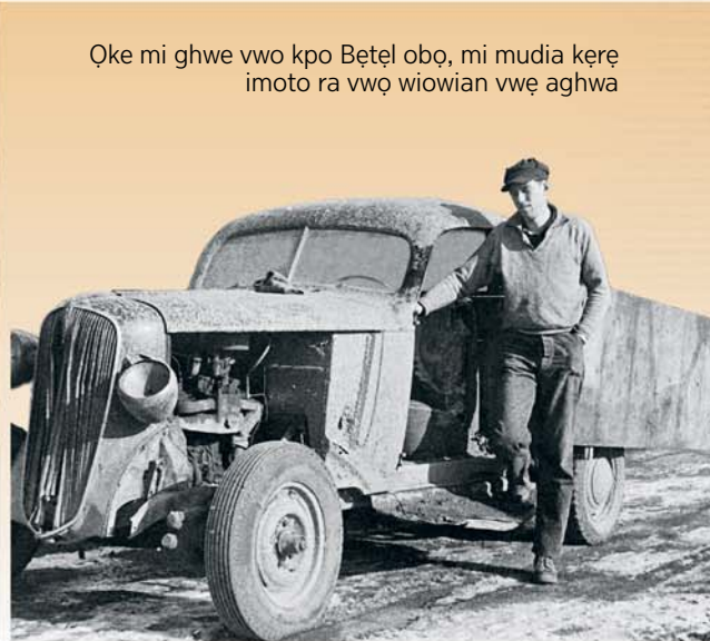
Oke mi ghwe vwo kpo Betel obo, mi mudia kere imoto ra vwọ wiowian vwe aghwa