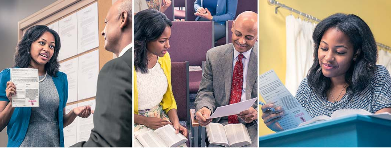
Ekpako ri wwo ẹgunṣo wwe ukecha ke iniṣo na ayen wwo yono obo re brorhiṣen romobṣo (Ni ẹkorota 11)

Egogedjo rehe otṣo na yen rieri ihwo re Izrel na, ayen de gbe nene egogedjo na. Jihova wwe orho-esio ke ayen oke grongron ro wanre ne oronwṣon tiṣna sa phia.—Eyan. 23:2.