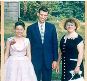
Me vẹ Angela kugbe Etta Huth