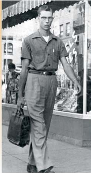
Me vwọ he iruo okobaro vwe 1952