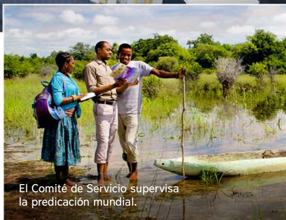
El Comité de Servicio supervisa la predicación mundial.