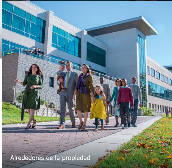
Alrededores de la propiedad