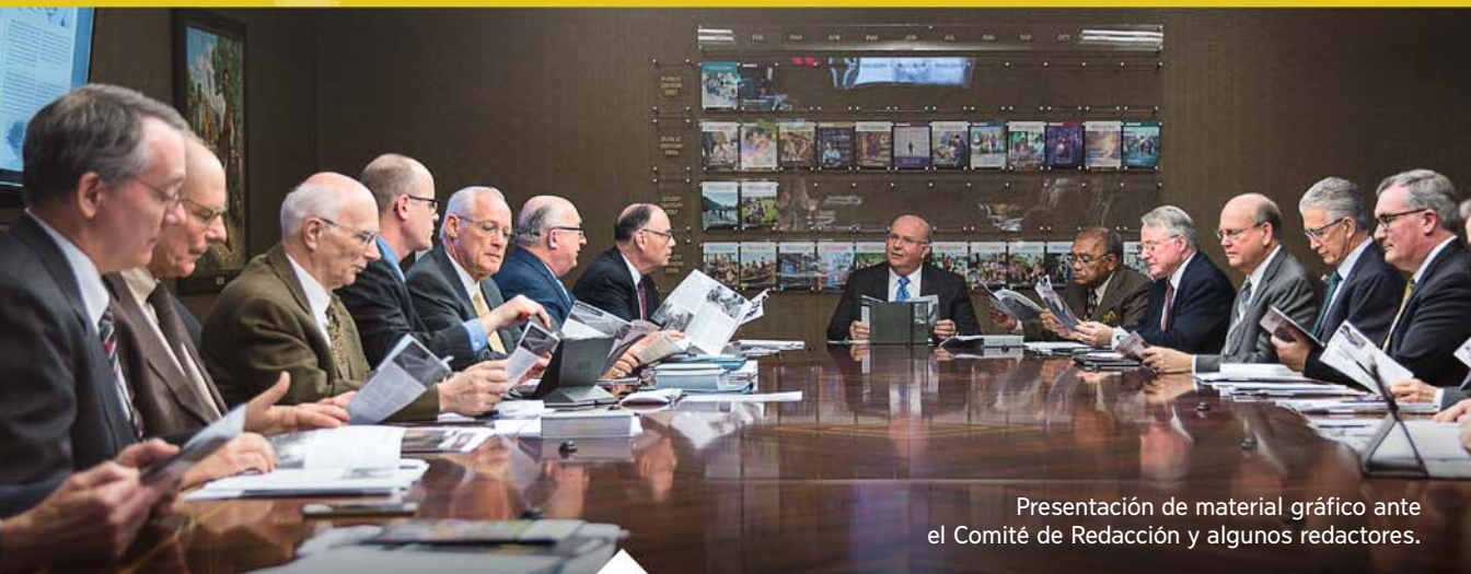
Presentación de material gráfico ante el Comité de Redacción y algunos redactores.

El Cuerpo Gobernante está organizado en seis comités, cada uno de los cuales supervisa un campo diferente con el objetivo de velar por los intereses del Reino. A través de estos seis comités se lleva a cabo el pastoreo espiritual del pueblo de Jehová.