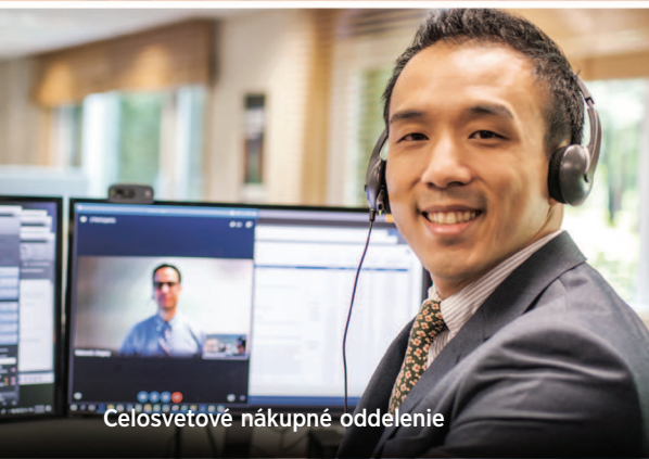
Celosvetové nákupné oddelenie