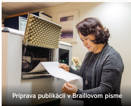
Príprava publikácií v Braillovom písme