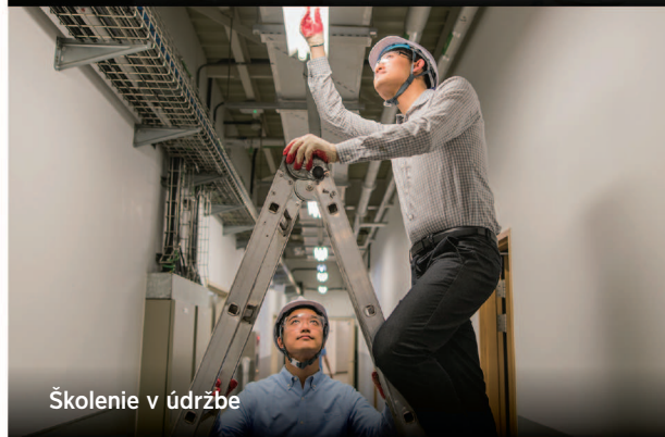
Školenie v údržbe