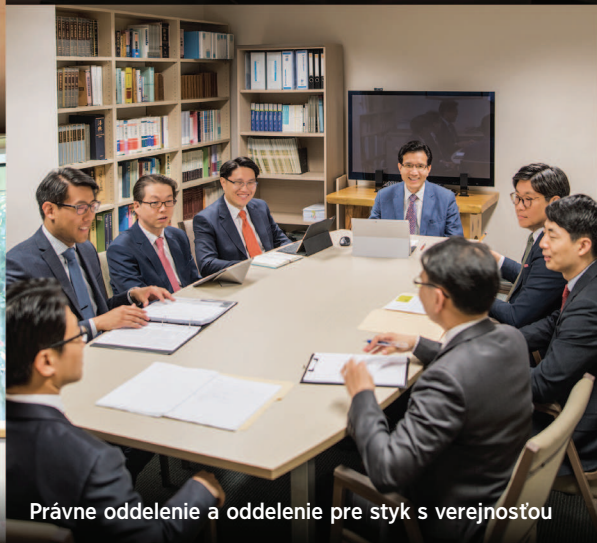
Právne oddelenie a oddelenie pre styk s verejnosťou