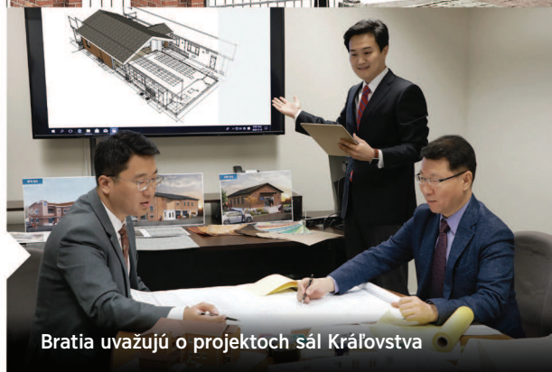
Bratia uvažujú o projektoch sál Kráľovstva

Aby budovy vydržali čo najdlhšie v dobrom stave, MPSO zabezpečuje pravidelné inšpekcie sál Kráľovstva. Vďaka tomu sa môže pohotovo vyriešiť akýkoľvek problém, či už sa týka údržby, alebo bezpečnosti budov. Okrem toho MPSO poskytuje školenie, aby sa miestni bratia a sestry v zboroch dokázali dobre starať o svoju sálu.