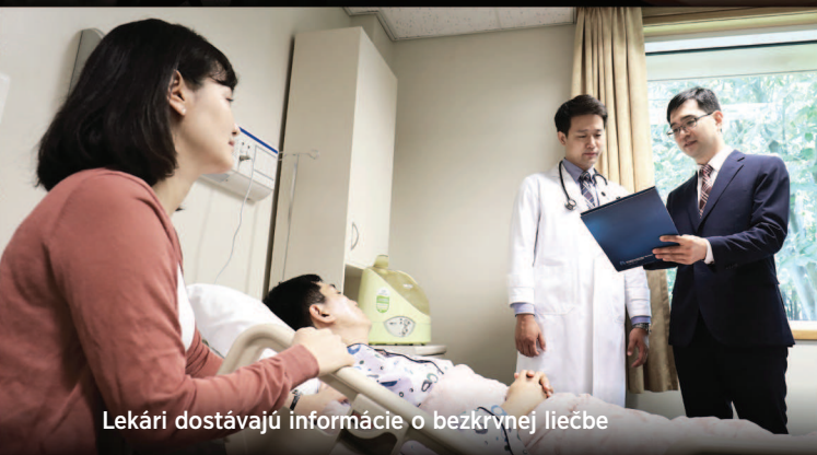
Lekári dostávajú informácie o bezkrvnej liečbe