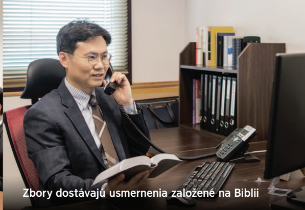
Zbory dostávajú usmernenia založené na Biblii