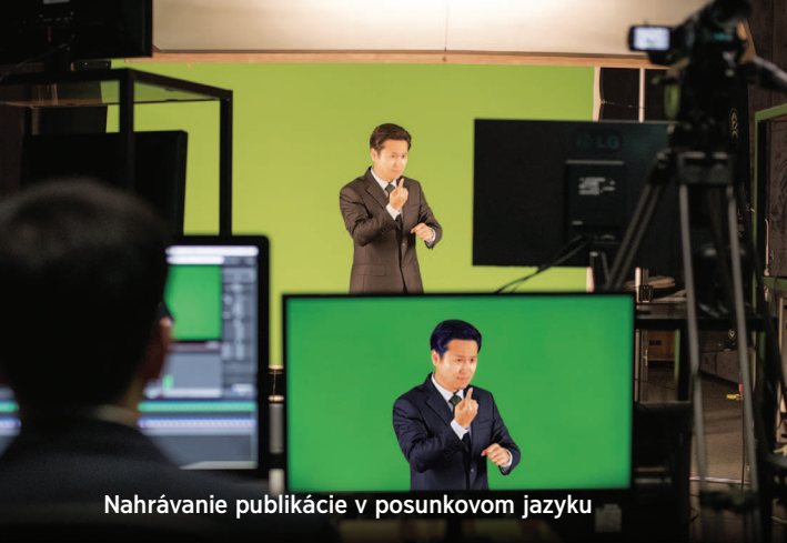
Nahrávanie publikácie v posunkovom jazyku