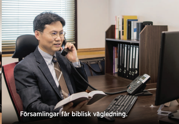
Församlingar får biblisk vägledning.