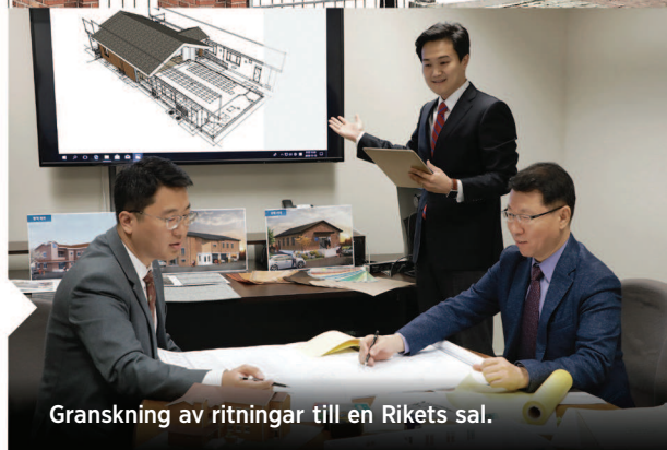
Granskning av ritningar till en Rikets sal.

För att ta hand om befintliga byggnader på bästa möjliga sätt ser LDC till att Rikets salarna besiktas regelbundet, vilket gör att man snabbt kan åtgärda sådant som gäller säkerhet och underhåll. LDC anordnar också underhållskurser för församlingsmedlemmar.