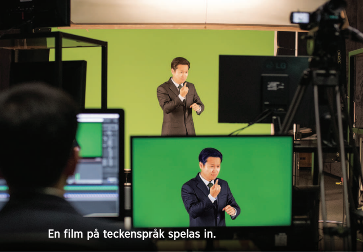
En film på teckenspråk spelas in.