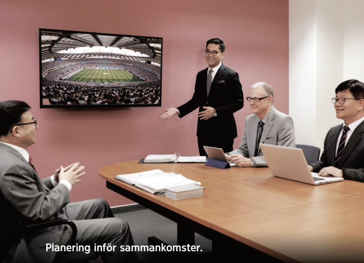
Planering inför sammankomster.