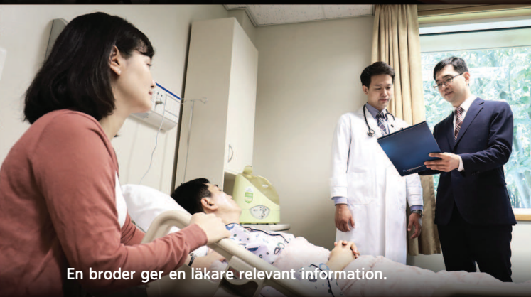
En broder ger en läkare relevant information.