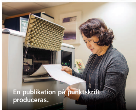
En publikation på punktskrift produceras.