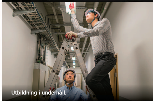
Utbildning i underhåll.