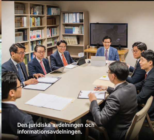
Den juridiska avdelningen och informationsavdelningen.